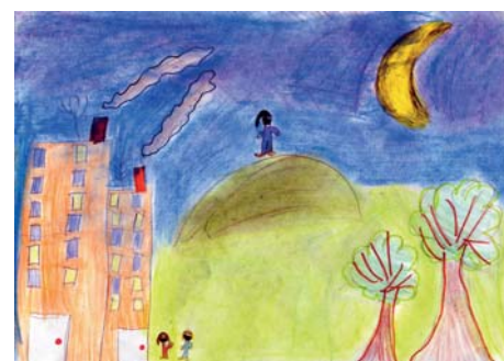
Alicja Bartuszek z kl. 3B