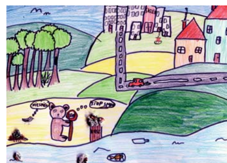
Zofia Rogowska z kl. 3B – wyróżnienie