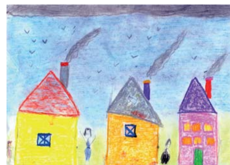
Emilia Wąsowicz z kl. 2B