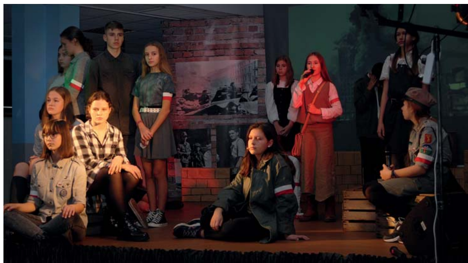
Część artystyczna w wykonaniu uczniów SP3