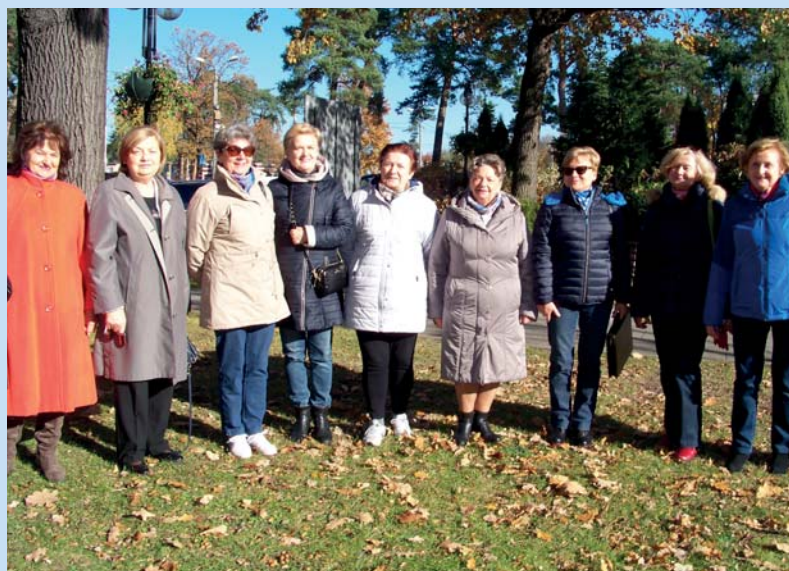
Na zdjęciu nowy zarząd józefowskiego Oddziału Rejonowego Polskiego Związku Emerytów, Rencistów i Inwalidów.