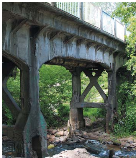
Prawie stuletni most tzw. kolejkowy

Radni poparli też pilne zlecenie ekspertyzy stanu mostu tzw. kolejkowego (53 000 zł), połowę tej sumy pokryje miasto Otwock. Prawie stuletni most był bezpieczny, nie miał właściciela – wyjaśniał burmistrz Marek Banaszek. Dopiero w tym roku uporządkowano jego stan prawny i można będzie zaplanować możliwości poprawienia jego fatalnego stanu.