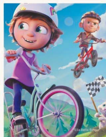
Ella Bella Bingo

31 18.00 Dobre, bo polskie: „Amatorzy” film. fab. reż.: I. Siekierzyńska pon. /Polska, 2020/ 95 min. bilety: 10 zł, kino Muza MOK