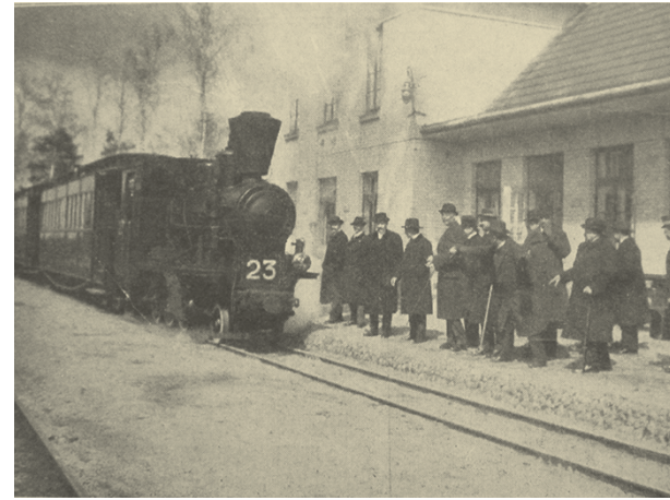
Otwarcie kolejki Wawer-Karczew

Wspomnienie kolejki wąskotorowej, kursującej przez Józefów przez 38 lat, wciąż budzi emocje u pamiętających ją osób. Lokomotywa puszczająca dym z komina i pełne ludzi otwarte wagony były lubianym elementem pejzażu. Pełniła ważną funkcję komunikacyjną pomiędzy dużymi podmiejskimi terenami a Warszawą. Przewożono nią towary, a wagony osobowe umożliwiały tanie podróżowanie zarówno stałych mieszkańców, jak i sezonowych gości w okresach letnich. Budynki stacyjne i przystanki stawały się centrami osiedlowego życia, do czego zachęcały funkcjonujące tam bary. Jeszcze po wojnie, do zamknięcia kolejki, okoliczne dzieciaki biegały na stację do kawiarenki po słodycze i gazety dla rodziców.