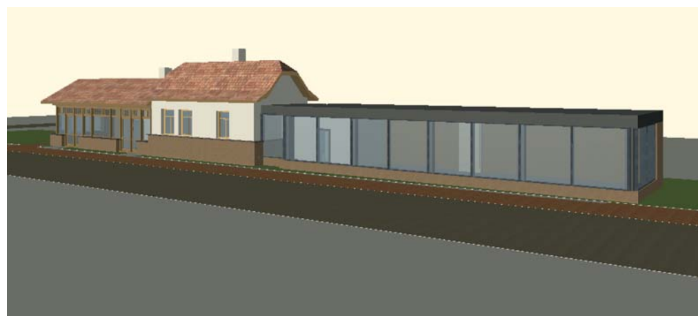
Wizualizacja projektu Stacja Intergracja

Ruch był duży, bilety dość tanie i choć po-