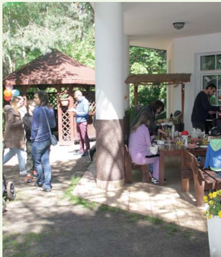
Piknik Przedszkole Szczęśliwych Dzieci