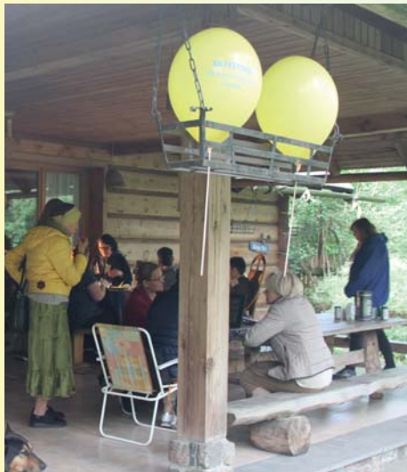
Dbalnia u Irki Chrzanowskiej