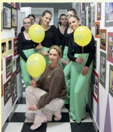
Studio tańca Saute