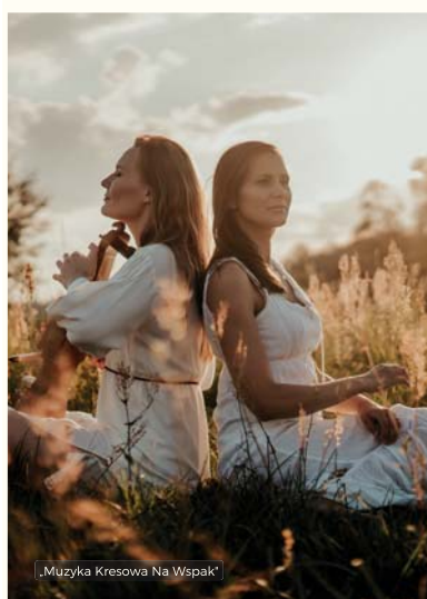
„Muzyka Kresowa Na Wspak”

„ Najpiękniejsze piosenki z polskich filmów i seriali ” wystąpi zespół Piramidy , scena plenerowa MOK