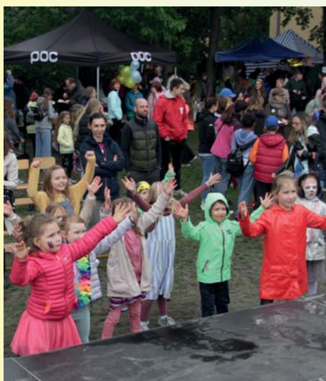
Piknik w SP2