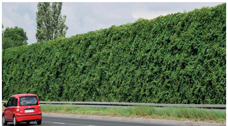
Pochłaniająco-rozpraszający ekran akustyczny wysokości 5 metrów, na całej swej powierzchni pokryty roślinnością pnącą ( www.techbud.com.pl/halas7.htm )

Kiedy w grudniu 2016 roku władze miasta i aktywiści józefowscy spotykali się w siedzibie PKP z władzami PKP PLK, nie było jeszcze wiadomo czy kolejarze uwzględnią nasze postulaty. Dziś wiemy, że wykonają niemal wszystko, o co prosiliśmy. Wiadukt dla samochodów i ciąg pieszo-rowerowy na