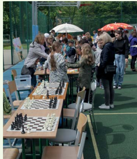
Piknik w SP1