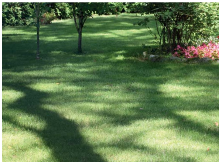
Nasze trawniki fotografowane zza płotów.