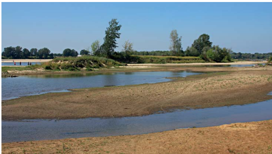
Objęte ochroną rezerwatową Wyspy Zawadowskie na Wiśle

Gdy stoimy patrząc na Wisłę, za plecami mamy teren Nowej Wsi. Niewielkie zabudowania, romantycznie ocienione sady i liczne ule nadają tej okolicy wiejski charakter. Idąc wzdłuż lasu ulicą Nowowiejską dochodzimy do jeziora Łacha, będącego jednym ze starorzeczy Wisły. Niegdyś miało ono połączenie z Wisłą – jeszcze we wczesnych latach osiemdziesiątych XX wieku. Niewielki kanał zwany „Strugą pod małym gajem” wychodził z północnego krańca jeziora i wpływał już na terenie Falenicy do Wisły. Powierzchnia Łachy to około 11 hektarów, w najgłębszym miejscu w środkowej części jest około sześciu metrów do dna, które miejscami opada bardzo szybko. Głębokie doły zdarzają się także blisko brzegu, a w paru miejscach biją z dna źródła – ich bardzo zimna woda może do-