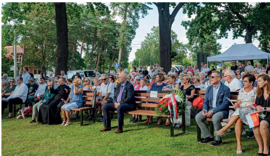
W uroczystości wzięli udział liczni mieszkańcy Józefowa i goście