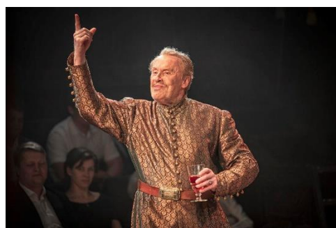
Zemsta Teatr Stu