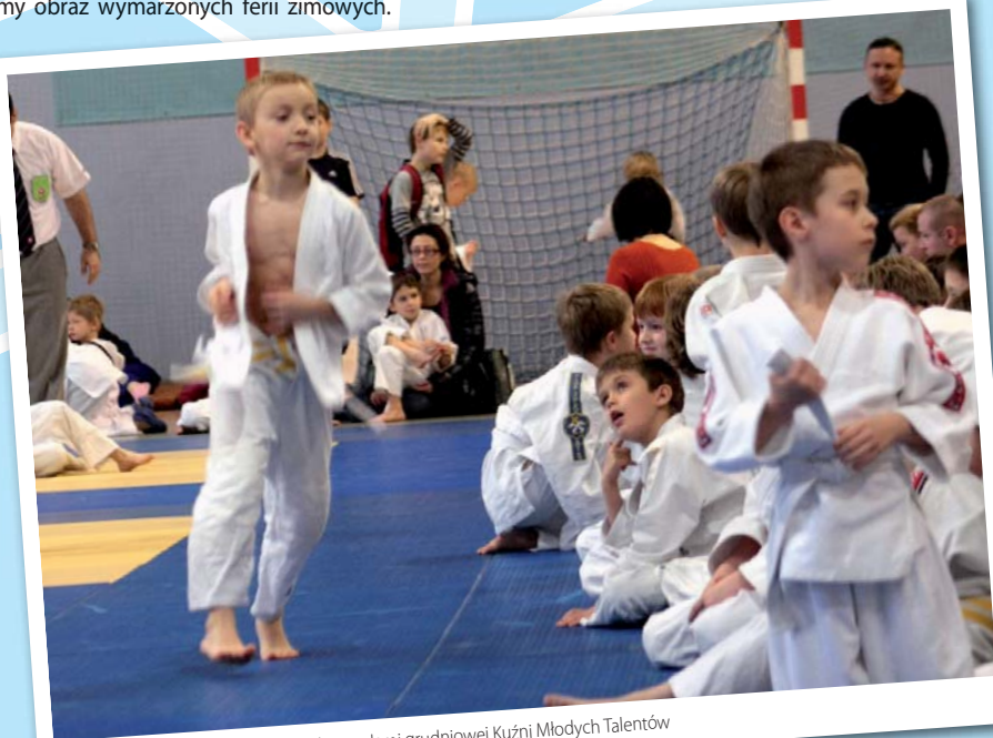
Rozgrzewka młodych judoków przed zawodami grudniowej Kuźni Młodych Talentów