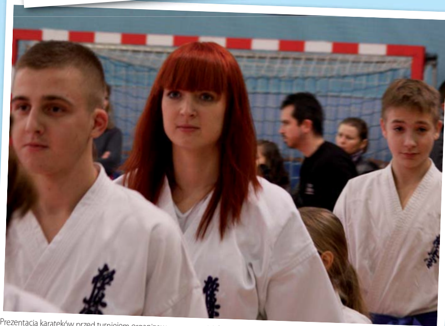
Prezentacja karateków przed turniejem organizowanym przez UKS Bushi

W momencie zamykania tego numeru „Józefowa nad Świdrem” listy uczestników propozycji pierwszej i trzeciej były zamknięte, wariant drugi był cały czas dostępny. Co waż-