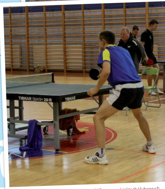
Półkolonia Józefovii odbywać się będzie w ICSiR oraz na obiektach klubowych

O ile młodszy klubowicze spędzą „zimę w mieście”, o tyle ferie dla starszych reprezentantów Józefovii, urodzonych w latach 1999–2000 i 2001–2002, oznaczać będą wyjazdy. W tym czasie obie drużyny wezmą udział w obozach sportowych.