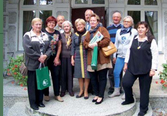
Laureaci z władzami miasta

Małe przydomowe ogródki nawiązują do rolniczej tradycji tego terenu, gdy przy każdym prawie domu kawałek gruntu poświęcano na uprawę kwiatów i kwitnących krzewów.