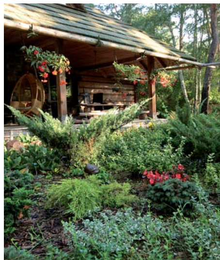
Ogród Ireny Chrzanowskiej przy ul. Wilsona

i klimatyczne kącki dla wszystkich członków rodziny.