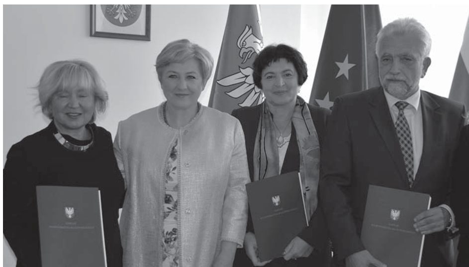
Podpisanie umowy na środki unijne w Mazowieckim Urzędzie Marszałkowskim

projekt: „E-rozwój dla pacjentów i pracowników SPZOZ Przychodnia Miejska w Józefowie” pozwoli na wdrożenie sześciu usług elektronicznych: e-rejestracja, e-skierowania, e-wyniki badań, e-zlecenie na usługi medyczne, e-dostęp do dokumentacji medycznej, e-oświadczenia.