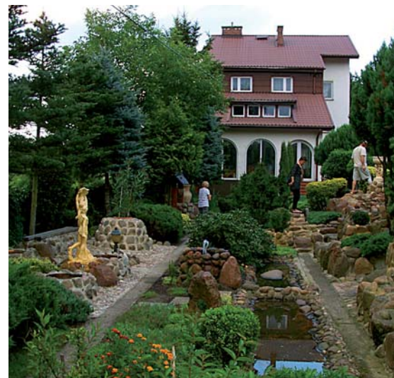
Ogród Bernarda Belki przy ul. Nadwiślańskiej