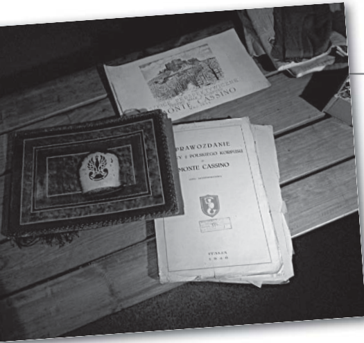
Dokumenty 2. Korpusu i album ze zdjęciami, a na nim matryca do malowania orła na helmach

teatru. Szanownym Gościom towarzyszyła realizująca reportaż ekipa Telewizji Polskiej.