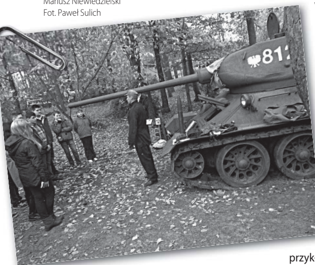
Kto był w czołgu T-34 (wolno wejść!) ten potwierdzi: wewnątrz miejsca dla psa nie starczy