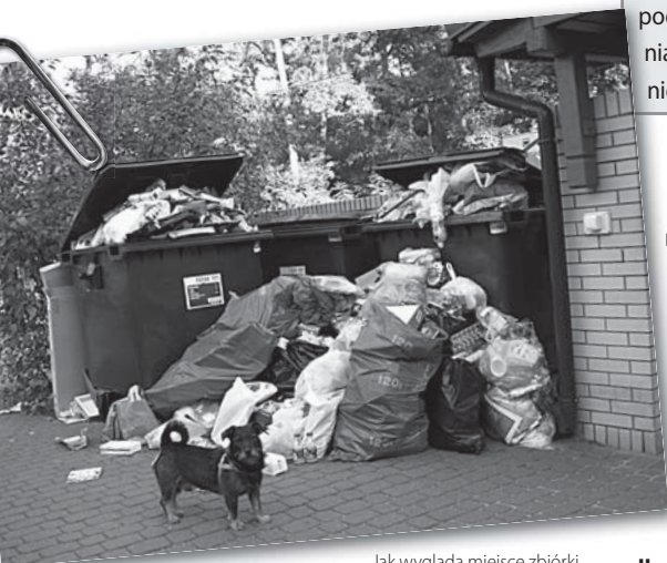
Jak wygląda miejsce zbiórki odpadów segregowanych na osiedlu TBS „Zielona” w drugim tygodniu, możecie Państwo zobaczyć na zdjęciu.