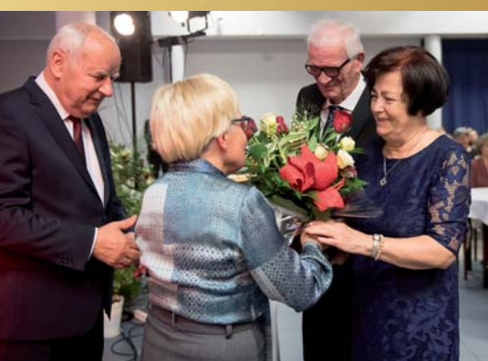
Medale wręcali przedstawiciele samorządu miasta Józefowa.