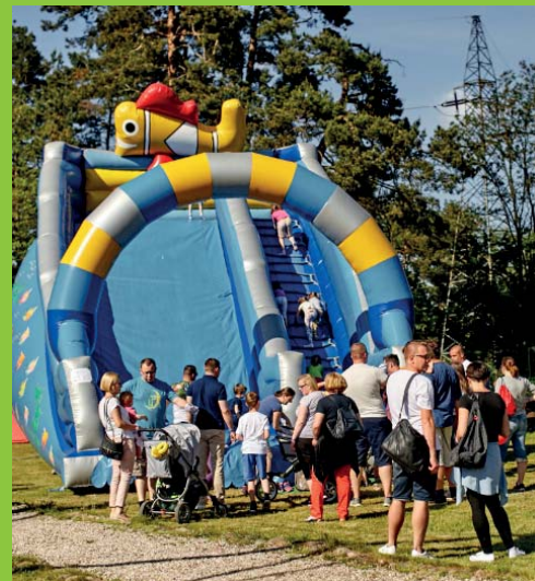
Uroczyste obchody jubileuszu na terenach rekreacyjnych Holiday Inn