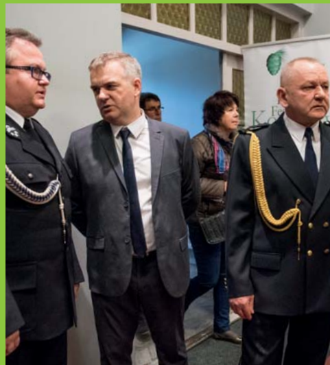
Pogawędki w kularach