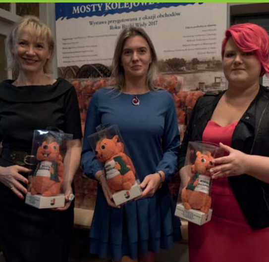
Ekipa organizatorów z wiewiórką – symbolem jubileuszu