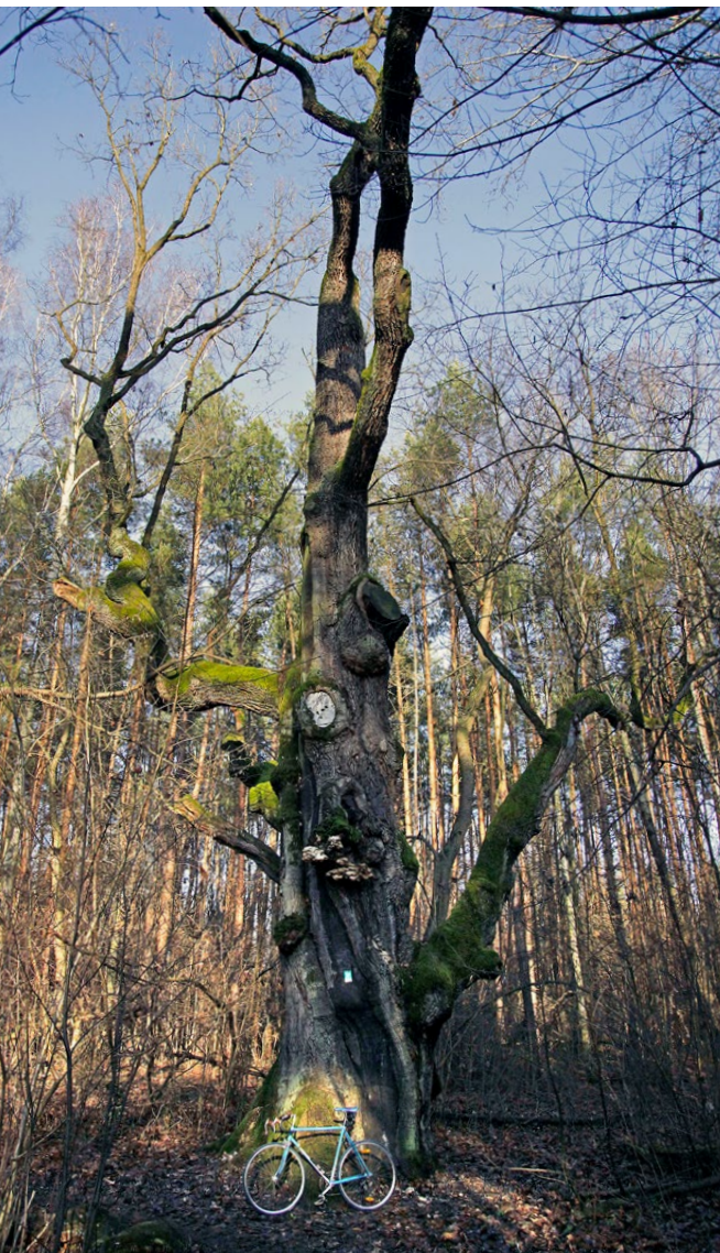
Pomnik przyrody nad malowniczą Mienią – Mazowiecki Bartek

Z Wiązowny przez Pęcłin i Dziechciniec kierujemy się na Gliniankę. Nim jednak do niej dotrzemy zatrzymajmy się w Malcanowie, wsi założonej w 1814 roku, której nazwa pochodzi wprost od nazwiska baronów von Maltzan, dawnych właścicieli dóbr wiązowskich. Z pewnością zwrócimy uwagę na nowoczesną wiatę dla rowerzystów, a za nią kompleks sportowo-rekreacyjny położony nad urokliwym oczkiem wodnym. To tzw. laguna, która przyciąga okolicznych mieszkańców zarówno w miesiącach letnich, jak i zimowych, gdy w jej wodach zanurzają się morsy. Jeśli za zbiornikiem wjedziemy w las, po