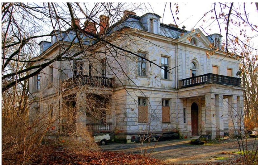
Osiemnastowieczny pałac w Wiązownie