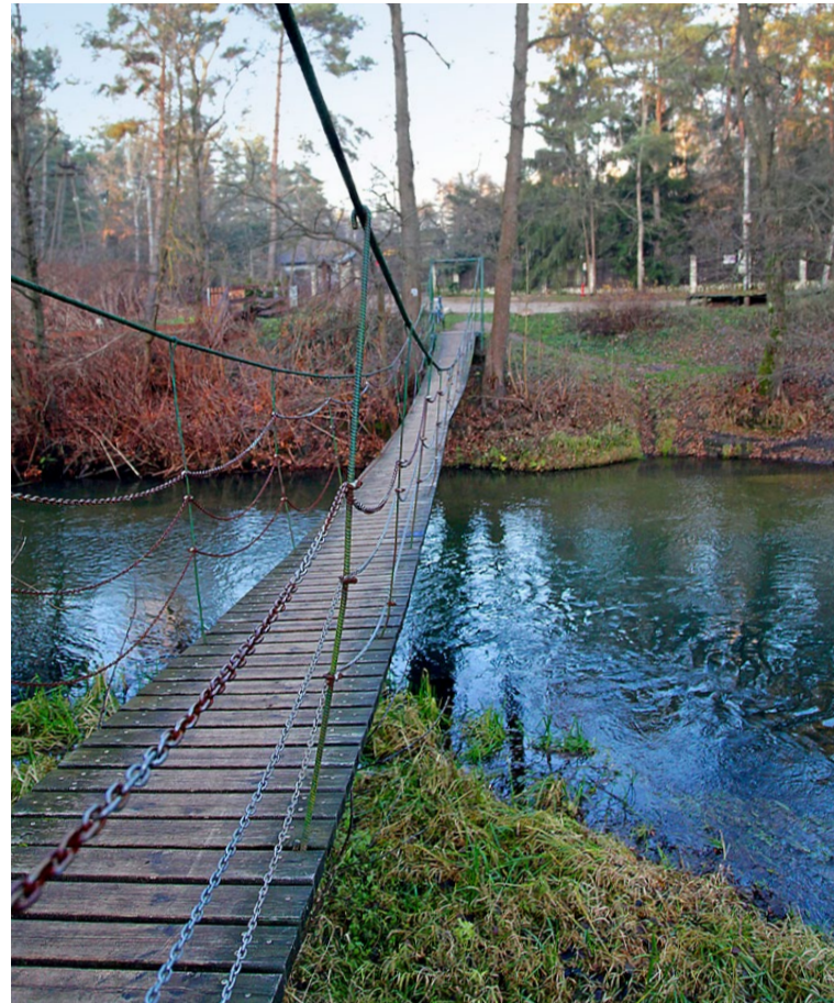
Jedyna nad Świdrem wisząca kładka piesza

około dwustu metrach natkniemy się na zrzutowisko „Pierzyna”, miejsce w którym w nocy z 3 na 4 kwietnia 1944 roku dokonano alianckiego zrzutu zawierającego broń, radiostacje z osprzętem i pieniądze.