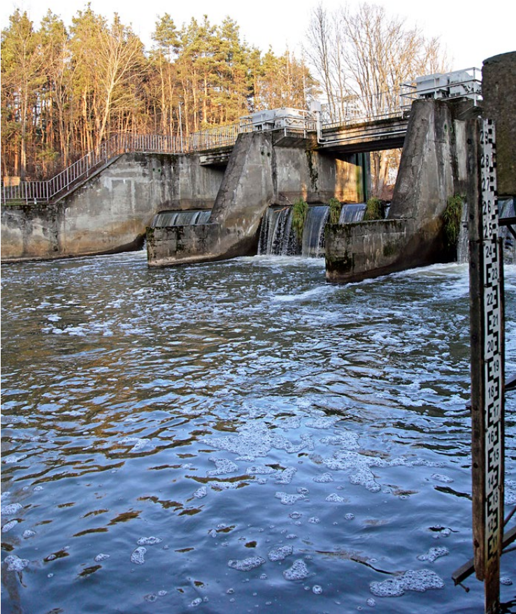
Jaz na rzece Świder w Woli Karczewskiej