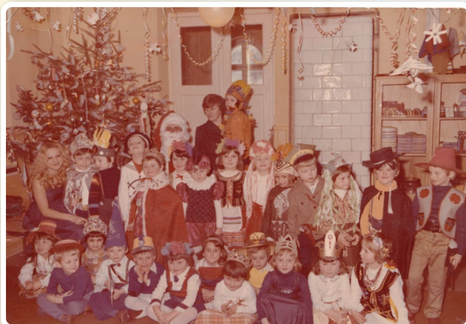
Oba powyższe zdjęcia: ok. 1979 r. Przedszkolaki podczas zabawy choinkowej, przedszkole nr 2 przy ul. Wyszyńskiego (wówczas Waryńskiego).