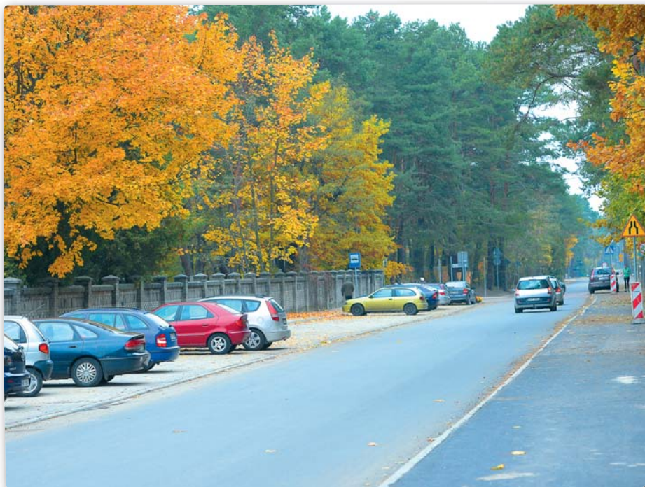
Tak wyglądała ulica Wawerska jesienią 2015 r. (okolice cmentarza)

Na zdjęciu nowe rondo Graniczna/Wawerska