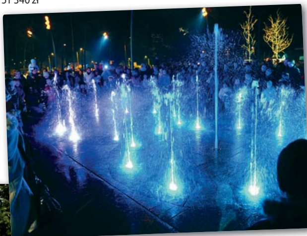
Na zdjęciach: fontanna na skwerze im. Św. JP II. W 2015 roku do dotychczasowych urządzeń fontanny dokupiono interfejs i urządzenia umożliwiające synchronizację światła i obrazów wodnych z muzyką.

wych budynków przy ul. Rejtana – 8100 zł