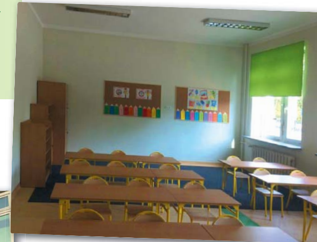
Na zdjęciach: pomieszczenia klasowe oznaczone różnobarwnymi roletami