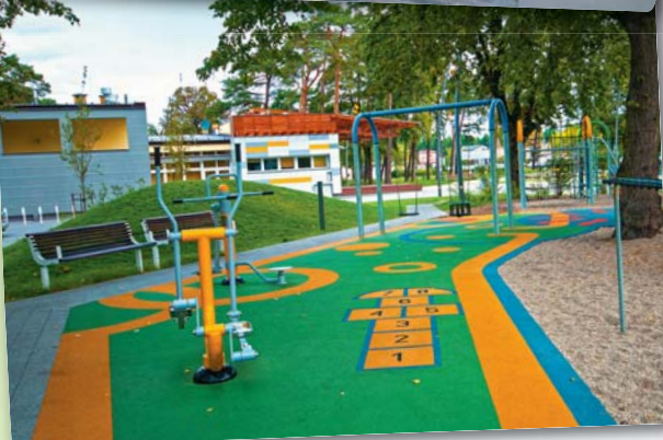
Na zdjęciach: zmodernizowany budynek MOK, plac zabaw na skwerze Świ. JP II oraz świąteczna dekoracja.