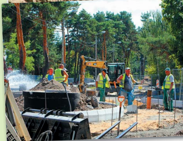
Tak przebudowywano ulicę Wawerską latem