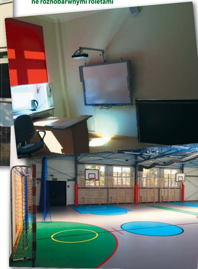
Na zdjęciu: sala sportowa do gier zespołowych