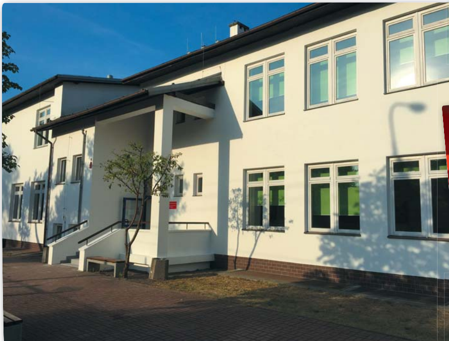
Na zdjęciu: zmodernizowany budynek szkolny przy ulicy Sienkiewicza.

■ Głęboka termomodernizacja budynków przy ul. Sienkiewicza 2 – sporządzenie dokumentacji technicznej, zadanie będzie realizowane w 2016 r. – 98 400 zł