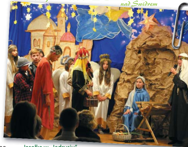
Jasełka w „Jędrusiu”