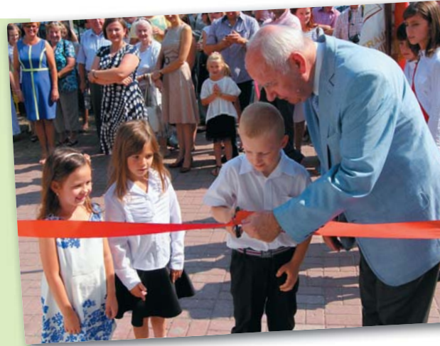
Na zdjęciu: uroczysty początek roku szkolnego w zmodernizowanym budynku przy ulicy Sienkiewicza 2 – wrzesień 2015 r.

Szkoła ma szereg udogodnień dla małych dzieci, np. kolorowe oznakowanie systemu komunikacyjnego oraz jest starannie wyposażona.