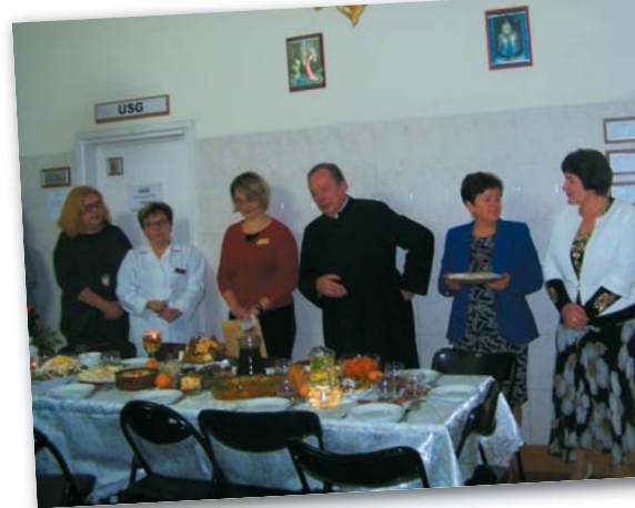
Wigilia w przychodni miejskiej

darzem parafii. Zanim jednak dzieci zostały obdarowane, przeniosły się w świat baśniowych przygód niesfornej księżniczki. W mikołajowej paczce tradycyjnie już znalazła się dodatkowa tabliczka czekolady od burmistrza.