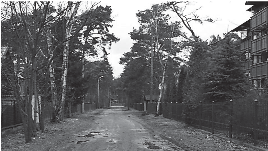
Tak obecnie wygląda ulica Staszica