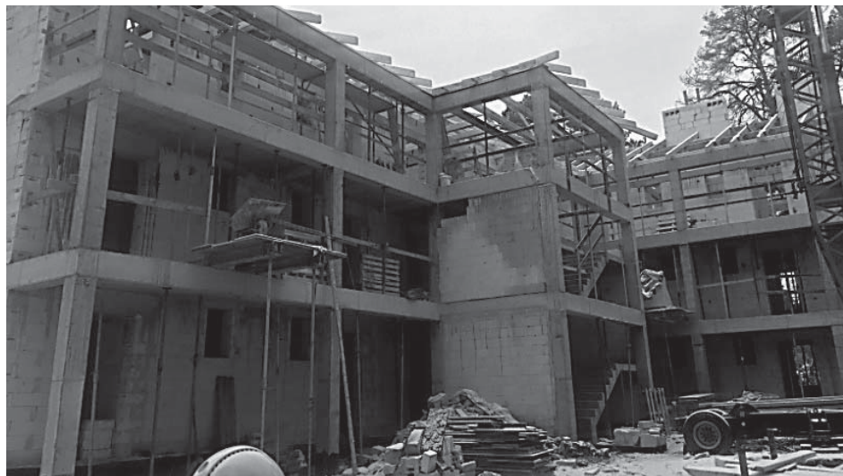
Budynek komunalny przy ulicy Wiązowskiej w trakcie budowy 39. mieszkań