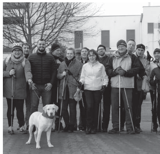
Sport i rekreacja cieszą się nieustającą popularnością – na zdjęciu grupa wyruszająca w intencji Gwiazdobrania i Dawania

Na zdjęciu tęźnia miejska w Katowicach. Jaka będzie nasza tęźnia?