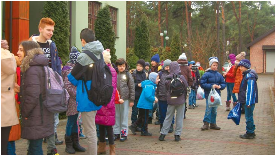
Dzieci i młodzież ze świetlicy przy ul. Dobrej przygotowują się do wyjazdu do centrum rozrywki Hulakula

W tym roku wcześniej niż zazwyczaj, bo już w drugiej połowie stycznia, opustoszeją józefowskie szkoły. Ferie! Dla tych rodzin, w których dzieciaki spędzą ferie w mieście, Stowarzyszenie „Forum Chrześcijańskie” oraz miejskie placówki kulturalne i sportowe przygotowały bogatą ofertę zajęć.