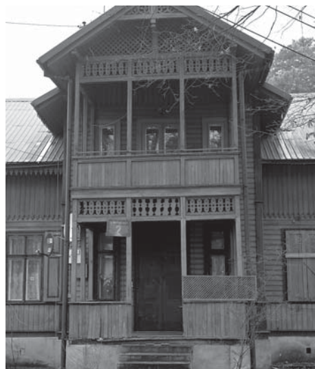
Ulica Kardynała Wyszyńskiego 2 – po przebudowie i adaptacji będzie tu nowy Dom Nauki i Sztuki

Jeden z najpiękniejszych józefowskich świdermajerów przy ul. Wyszyńskiego 2 podany zostanie modernizacji i renowacji, aby dostosować ten wspaniały obiekt do funkcji Domu Nauki i Sztuki. Na ten cel już wydaliśmy 78 940 zł a łączne nakłady zaplanowane na 2018 rok to 2 710 862 zł.