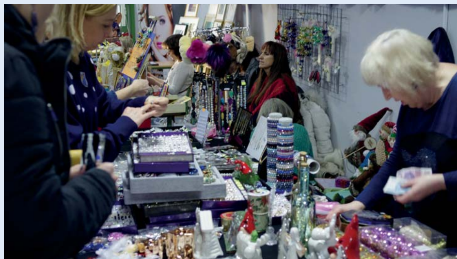
Zdjęcia z Gwiazdobrania na stronie 7 i 8 – Maciej Piłat