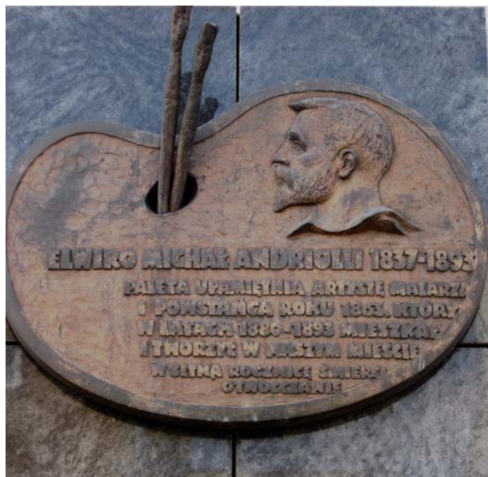
Tablica pamiątkowa w Otwocku.