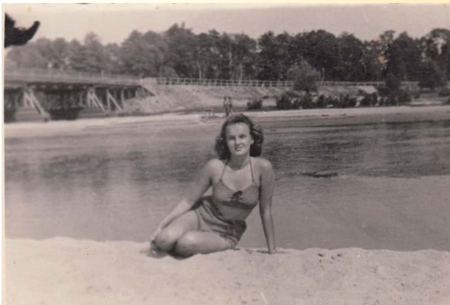
1946. Most na Świdrze.jpg

CATL – to szansa na ocalenie naszych wspomnień od zapomnienia. Dzięki programowi Fundacji Ośrodka KARTA mamy szansę na zachowanie pamiątek dla przyszłych pokoleń. Proszę zadzwonić do nas lub przyjść do biblioteki. Wykonamy cyfrową kopię takiego dokumentu lub fotografii, u Państwa nadal będzie oryginał, a w Archiwum Społecznym w naszej bibliotece – kopia.