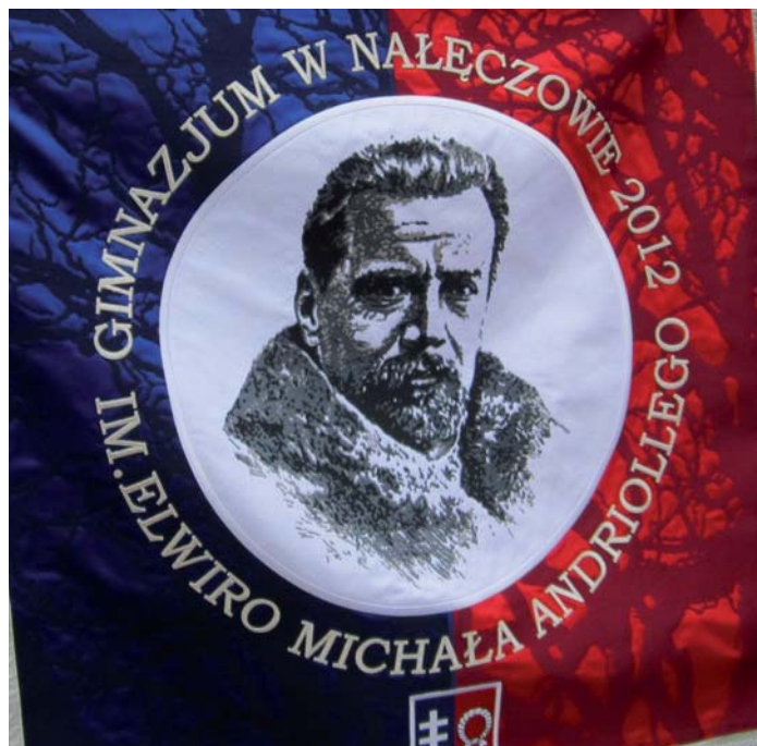
Sztandar b. gimnazjum w Nałęczowie.