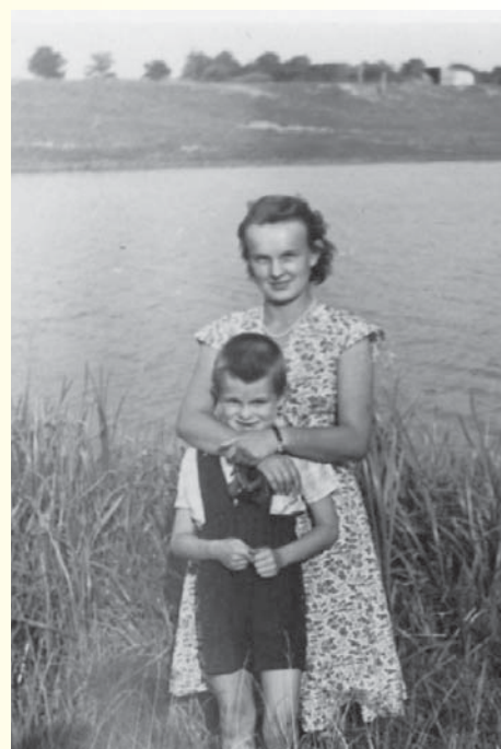
Lata 50. Nad Jeziorem Gąseckiego, Józefów