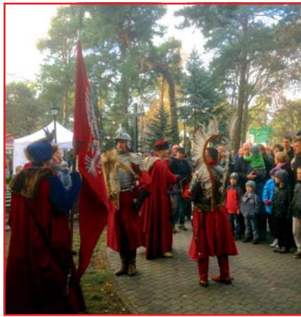
Piknik patriotyczny w kościele pw. M.B.Cz.