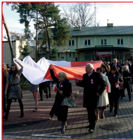
Przemarsz na start biegu niepodległości