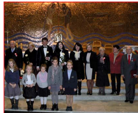
Koncert „W listopadowej zadumie”