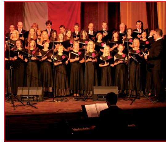
Chór Schola Cantorum Maximilianum