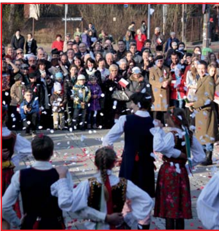
Szrzelano płatkami białych i czerwonych róż