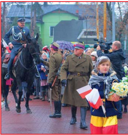
Szkoła Strumienie – żywa lekcja historii