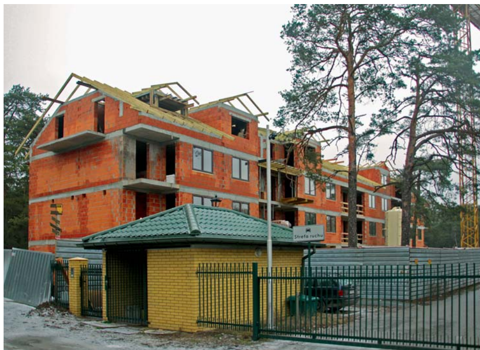
Zdjęcie z budowy oraz projekt elewacji budynku przy ul. Rejtana 1B

Spotkanie odbędzie się w Domu Nauki i Sztuki w Józefowie ul. Kardynała Wyszyńskiego 4