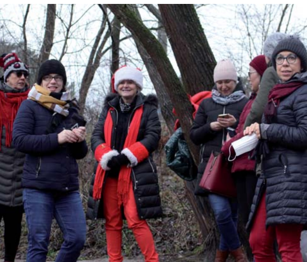
Zespół GiD zadbał o przeniesienie jarmarku do internetu