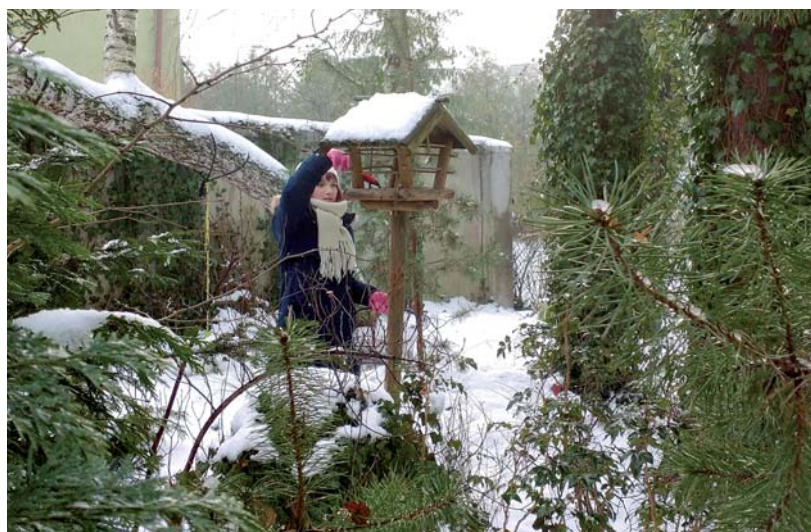
Fot. Katarzyna Marcinkiewicz