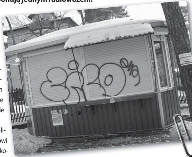
Fot. Zmyć tego nie można, można jedynie wymienić roletę.

10 stycznia na stronie internetowej Urzędu Miasta policja podziękowała mieszkańcom za czułość