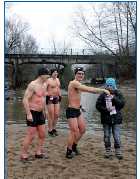
15 grudnia wolontariusze WOŚP dotarli także nad Świdem

Nad zimowy Świdem w weekendy zjeżdżają się rozmaite grupy morsów. Przybywają z Józefowa, Otwocka i okolic, ale także z Warszawy.