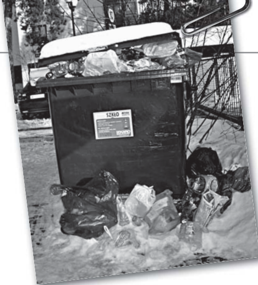
Kontener na szkło mieści w sobie plastik, papier i wszystko inne...