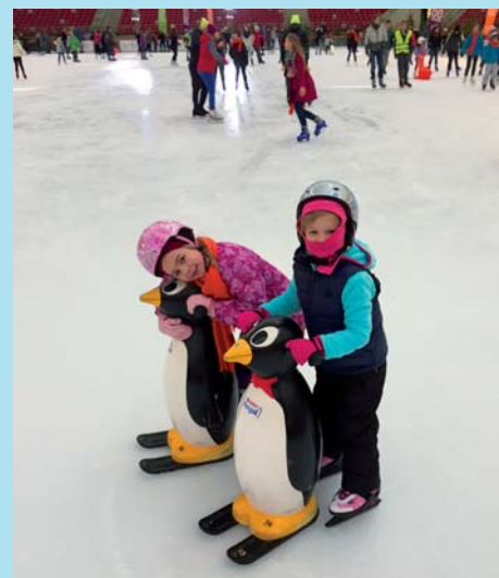
ICSIR: WYJAZD NA STADION NARODOWY