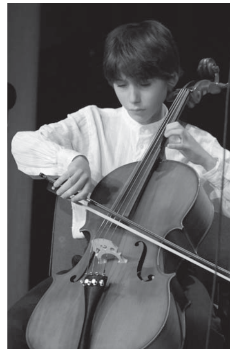
KONCERT W WYKONANIU JEDNEGO Z UCZNIÓW PRYWATNEJ SZKOŁY MUZYCZNEJ

22 stycznia mieliśmy okazję obejrzyć młodzież z Gimnazjum i Liceum im. św. Tomasza z Akwinu w Józefowie w przedstawieniu wg „Pastorałki” Leona Schillera. Bardzo atrakcyjna scenografia, kolorowe kostiumy nawiązujące do polskiej tradycji ludowej, dowcipne dialogi i wartka akcja, młodzi, niezwykle zaangażowani aktorzy – wszystko to spotkało się z zainteresowaniem publiczności. Dużo radości widzom sprawili najmłodszy uczestnicy przedstawienia, którzy ubrani w „skóry” udawali baranki i z wdziękiem brykali wokół stajenki.