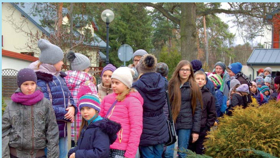
ŚWIETLICA W JÓZEFOWIE: ZBIÓRKA PRZED WYCIECZKĄ