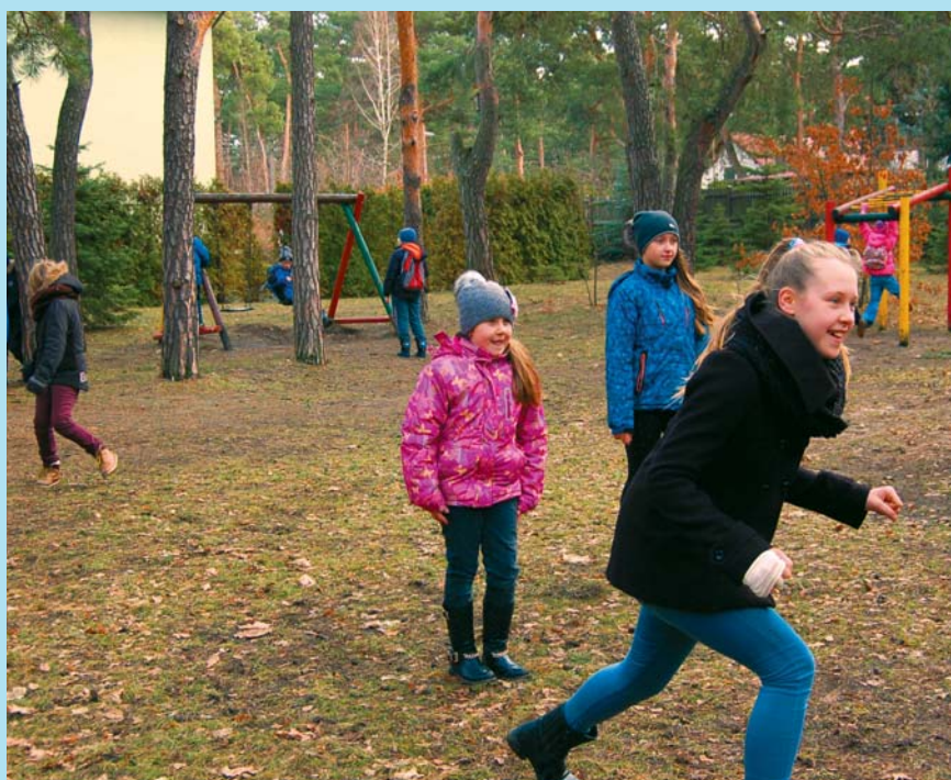
ŚWIETLICA PRZY UL. DOBREJ: ZABAWY NA POWIETRZU