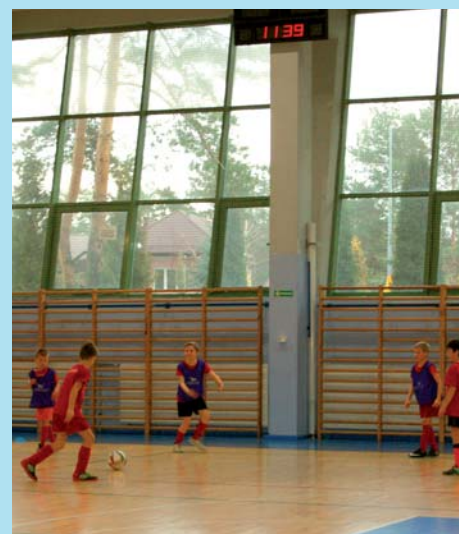
W HALI SPORTOWEJ ICSIR