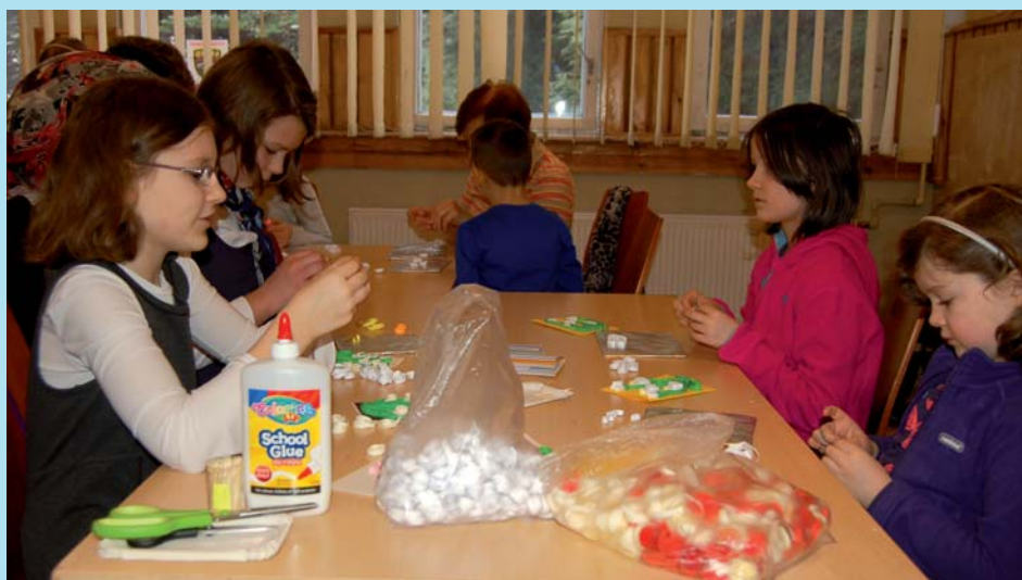
ZAJĘCIA ARTYSTYCZNE W MOK-U – QUILLING, CZYLI PAPIEROWE ZAKRĘCENIE