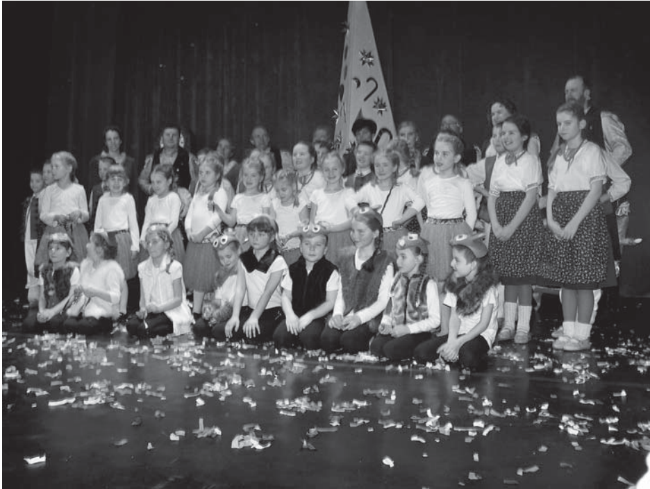
ZESPÓŁ TAŃCA POLSKIEGO