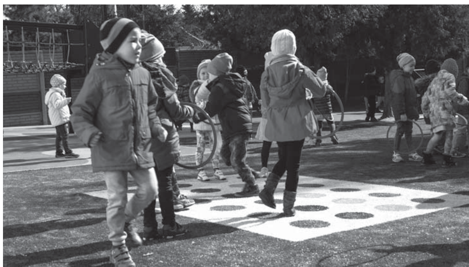
Zabawa na świeżym przedszkolu w Miejskim Przedszkolu nr 1