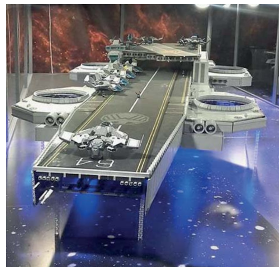
Lotniskowiec z klocków Lego na Stadionie Narodowym

Utartym zwyczajem istotną atrakcją józefowskiej akcji zimowej były wycieczki autokarowe do Warszawy. Pierwsza z nich odbyła się 22 stycznia, a w planie dnia znalazły się wyjście do kina na film „Jumanji – Przygoda w dżun-