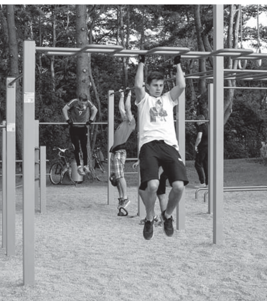
Plac do kalisteniki przy zbiegu ulic Polnej i Wawerskiej