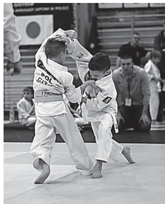
Dotacje obejmują między innymi działalność związaną z upowszechnianiem kultury fizycznej i sportu wśród dzieci

Referat Oświaty, Kultury, Zdrowia i Sportu