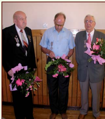
Odznaczenia dla kombatantów