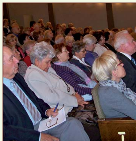
Na wykładzie inauguracyjnym rok akademicki 2011/2012