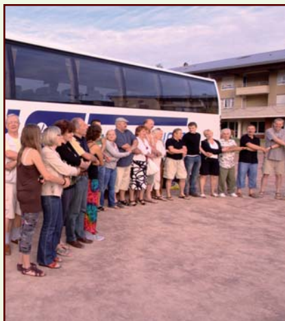
Nawiązały się prawdziwe przyjaźnie między rodzinami