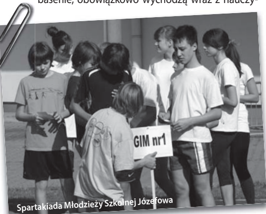
Spartakiada Młodzieży Szkolnej Józefowa

Młodzieżowy Ośrodek Socjoterapii znany jest także ze swej gościnności. Jego flagową imprezą jest odbywający się tradycyjnie w ostatni piątek maja festyn pod hasłem „Majówka w Jędrusiu”. Wydarzenie to co roku przyciąga ponad pół tysiąca dzieci z powiatu otwockiego i Warszawy. Żelaznym punktem każdej majówki są sztafetowe biegi przełajowe, w których, poza wychowankami placówek opiekuńczych, uczestniczą także uczniowie z józefowskich szkół podstawowych. Drugie przedsięwzięcie sportowe, od lat kojarzone z placówką przy ulicy Głównej, to przeprowadzany na boisku ze sztuczną nawierzchnią turniej piłkarski. W zawodach tych biorą jednak udział wyłącznie dzieci z ośrodków podobnych do „Jędrusia”. – W marcu ponadto, tradycyjnie już, będziemy współorganizatorem dwóch dużych imprez zewnętrznych o zasięgu ogólnopolskim – Międzywojewódzkich Mistrzostw Młodzików, Mistrzostw Mazowsza i Warszawy w biegach przełajowych oraz maratonu rowerowego wieńczącego cykl Northtec MTB Zimą. W 2011 roku byliśmy także gospodarzami organizowanych przez Victorię Józefów mistrzostw Mazowsza w klasycznym biegu na orientację – wy-