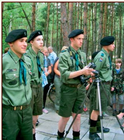
Podczas uroczystości na Górze Lotnika

Członkami Szczepu są zuchy i harcerze obu szkół podstawowych w Józefowie i w Michałinie oraz gimnazjum. Starsi harcerze i dorośli instruktorzy działają w zastępie wędrowniczym i w kręgu instruktorskim. Prowadzą zbiórki, rajdy, biwaki i ogniska. Podczas gier terenowych uczą wychowanków posługiwania się mapą, radzenia sobie w trudnych sytuacjach, odnajdywania drogi, a także zachowań ekologicznych. Dbają o rozwój fizyczny i duchowy dzieci, o kształtowanie charakterów młodzieży. Uczą koleżeństwa, odpowiedzialności, postaw patriotycznych i społecznych. Harcerze biorą więc udział w uroczystościach patriotycznych i kościelnych. Zawsze są obecni na obchodach święta Konstytucji 3 Maja i Święta Niepodległości 11 listopada.