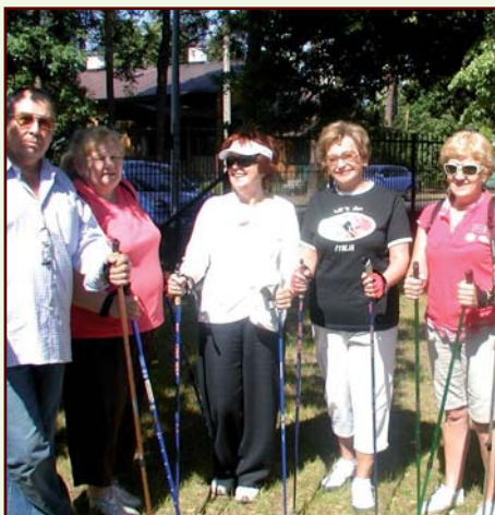
Nordic walking jest coraz bardziej popularny wśród seniorów