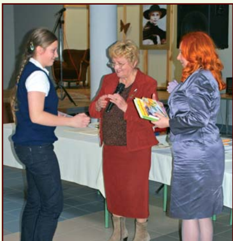
Nagrody w konkursie plastycznym w gimnazjum