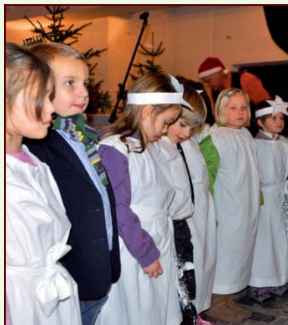
Imprezy mikołajkowe kończą się wręczeniem paczek