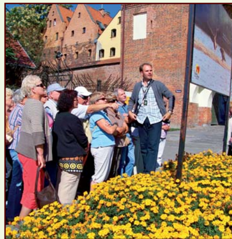
TPJ na wycieczce w Toruniu