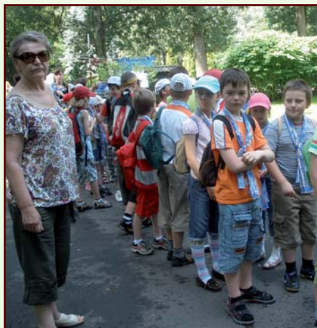
Z letnich półkolonii korzysta coraz więcej dzieci