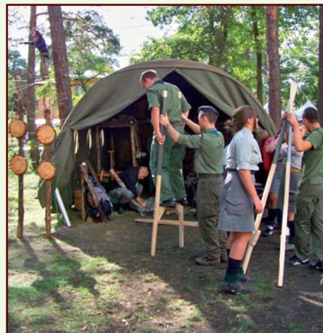
Harcerski biwak na festynie parafialnym

Tatrzańskim rajdem obchodzili zeszłoroczne pożegnanie jesieni. Każdego roku organizują wy-