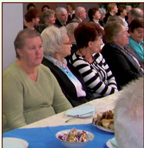
Obchody dnia seniora