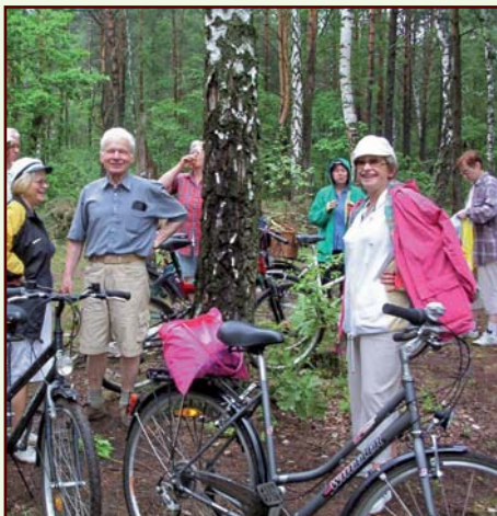
UTW na wycieczce rowerowej