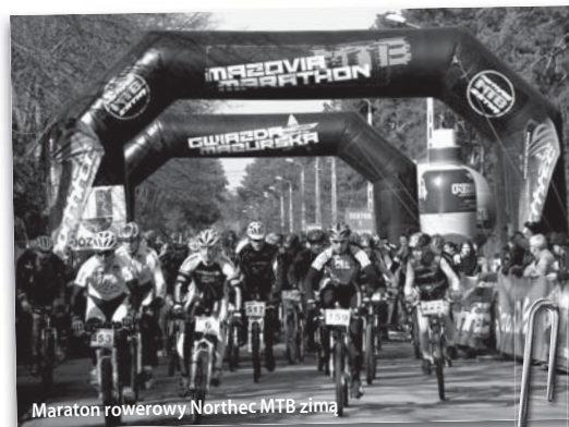
Maraton rowerowy Northtec MTB zima