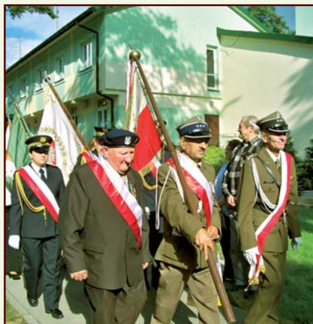
Podczas uroczystości patriotycznych

Siedziba: Dom Nauki i Sztuki w Józefowie przy ulicy Kardynała Wyszyńskiego 4.