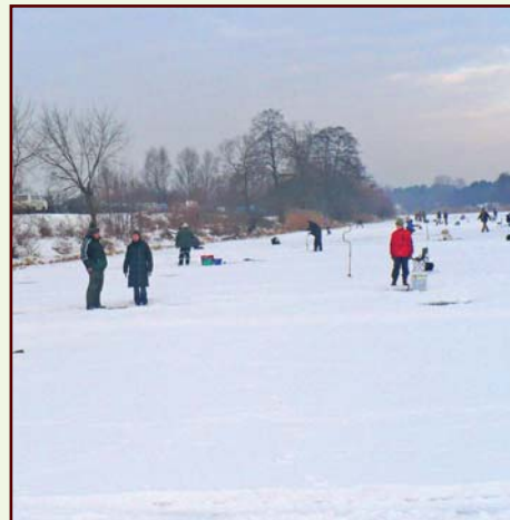
Zanim złowi się taa...ką rybę trzeba jezioro i Świder zasilić nowym narybkiem