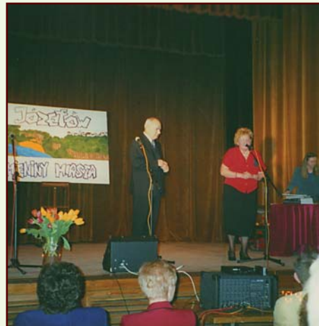
Imieniny miasta stały się tradycją

Siedziba TPJ znajduje się w Domu Nauki i Sztuki w Józefowie przy ulicy Kardynała Wyszyńskiego 4.