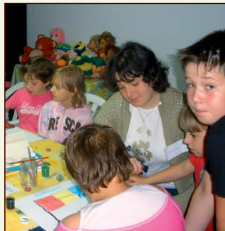
Co roku do Józefowa przyjeżdżają wolontariusze z całego świata dba o rozwój duchowy wychowanków.

W swoich dwóch świetlicach przy parafiach stowarzyszenie nie tylko opiekuje się dziećmi, którym dom rodzinny nie zapewnia właściwych warunków do nauki, odpoczynku i zabawy, ale też