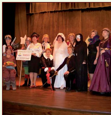
Hamlet Jerzego Przybory – zespół w komplecie