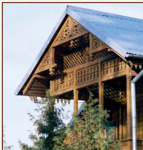
Świdermajerowski styl występuje także w nowych budynkach