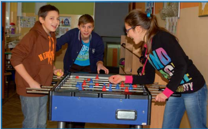
Sportowo w SP nr 1