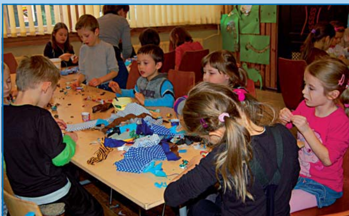
Warsztaty plastyczne – Szuflandia w Domu Nauki i Sztuki