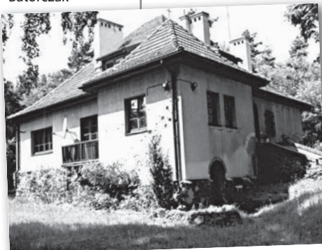
Tajemniczy dom przy ul. Nadwiślańskiej 100. Jeden z trzech (tylko!) obiektów w Józefowie, który został wpisany w rejestr zabytków. Widnieje w portalu Otwarte Zabytki, ale poza numerem w rejestrze nie mamy o nim żadnych informacji. Może ktoś z Państwa, obecny właściciel lub sąsiedzi mogą uzupełnić dane, opisać historię budynku, zamieścić fotografie. Zabytki to przecież nasze wspólne dziedzictwo kulturowe, ważne dla nas i dla następnych pokoleń.