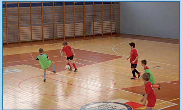
Trening podopiecznych Józefovii Józefów – hala ICSiR