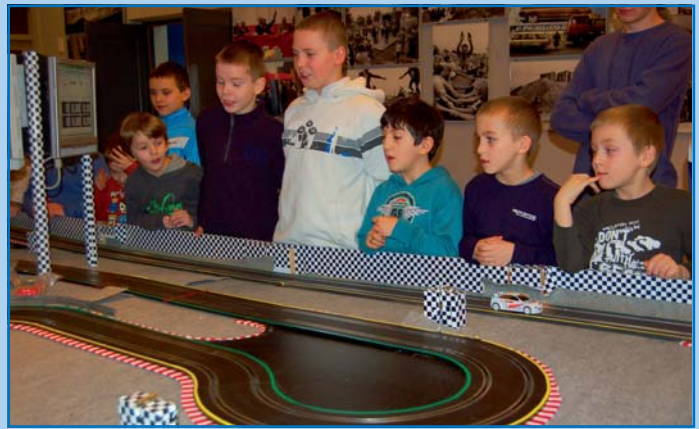
Liga RC w MOK-u