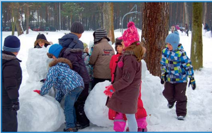
Iglo wykonane przez dzieci ze Szkoły Podstawowej nr 2