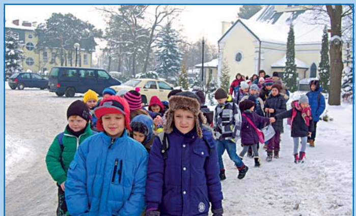
Wychowankowie świetlicy przy ul. 3 Maja wyruszają na wycieczkę