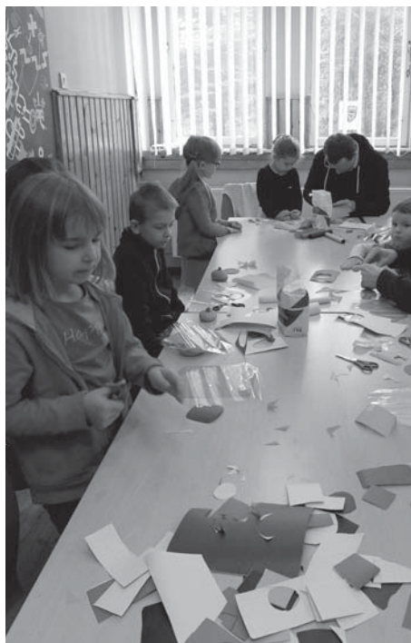
WARSZTATY W DOMU NAUKI I SZTUKI

Podczas spotkania uczestnicy usłyszeli opowieści o dawnych zabawkach, dzieci dowiedziały się jak wyglądały kiedyś odpusty i jarmarki, jakie popularne i charakterystyczne zabawki na nich sprzedawano. Wspólnie wykonane zostały kolorowe piłeczki na gumce. Jak się okazało proces przygotowania takiej odpustowej zabawki nie był wcale taki prosty. Używano starych pończoch, mąki jako wypełniacza, kolorowych papierów, sreberka lub celofanu. Każde dziecko z pomocą opiekunów i instruktorki wykonało swoją własną, niepowtarzalną piłeczkę.