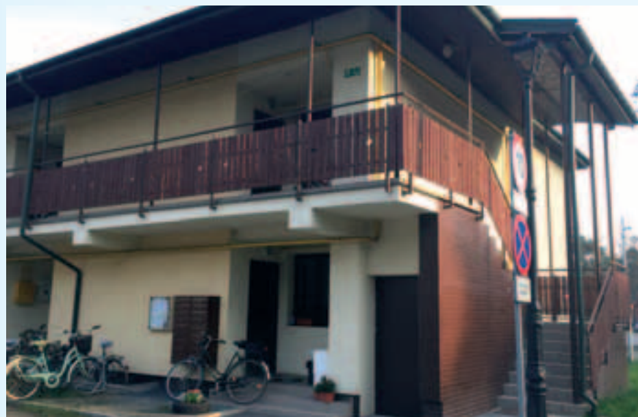
Budynek na osiedlu przy ul. Rejtana 1A