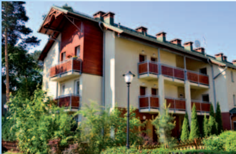
Budynki na osiedlu przy ul. Zawiszy 24, 26, 28