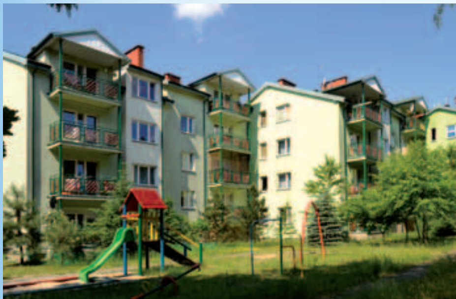
Budynki na osiedlu przy ul. Wroniej 9, 11, 13