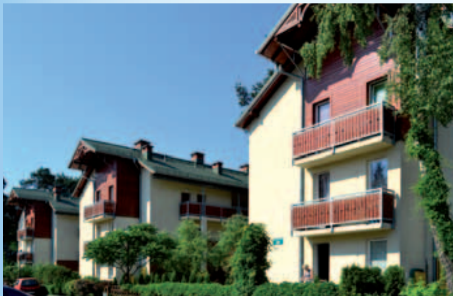
Budynki na osiedlu przy ul. Zawiszy 24, 26, 28

► budynków wielorodzinnych (30 lokali w każdym), przy finansowym wsparciu Banku Gospodarstwa Krajowego.