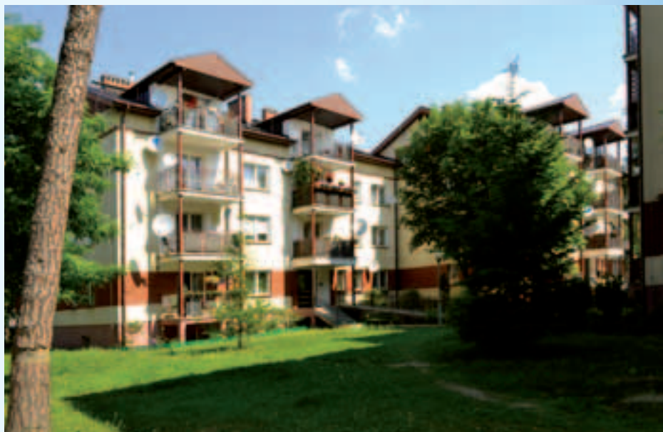
Budynki na osiedlu przy ul. 3 Maja 98 i 98A

Mieszkania wybudowane w ramach systemu budownictwa TBS to pełnowartościowe, energooszczędne lokale o relatywnie niskim czynszu. Misją TBWS jest realizacja miejskiej polityki mieszkaniowej przy zapewnieniu trwałości ekonomicznej spółki i wysokiej jakości obsługi klientów.