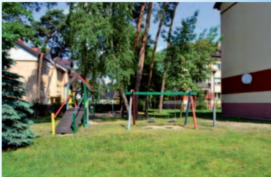
Budynki na osiedlu przy ul. 3 Maja 98 i 98A

Towarzystwo Budownictwa Społecznego w Józefowie Sp. z o.o. posiada 563 lokale mieszkalne o łącznej powierzchni użytkowej 27 729 m 2 .