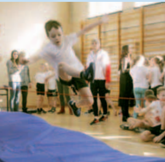
– Najmłodszy, którzy dla bezpieczeństwa nie skakali jeszcze przez tyczkę lecz przez gumę, również chcieli pokazać się w technice skoków przed wicemistrzynią olimpijską z jak najlepszej strony.