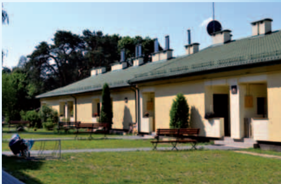
Budynek na osiedlu przy ul. Rejtana 3/5

Wychodząc naprzeciw temu zapotrzebowaniu spółka pracuje nad programem realizacji budowy lokali mieszkalnych w nowym systemie dla dobra społeczności lokalnej.