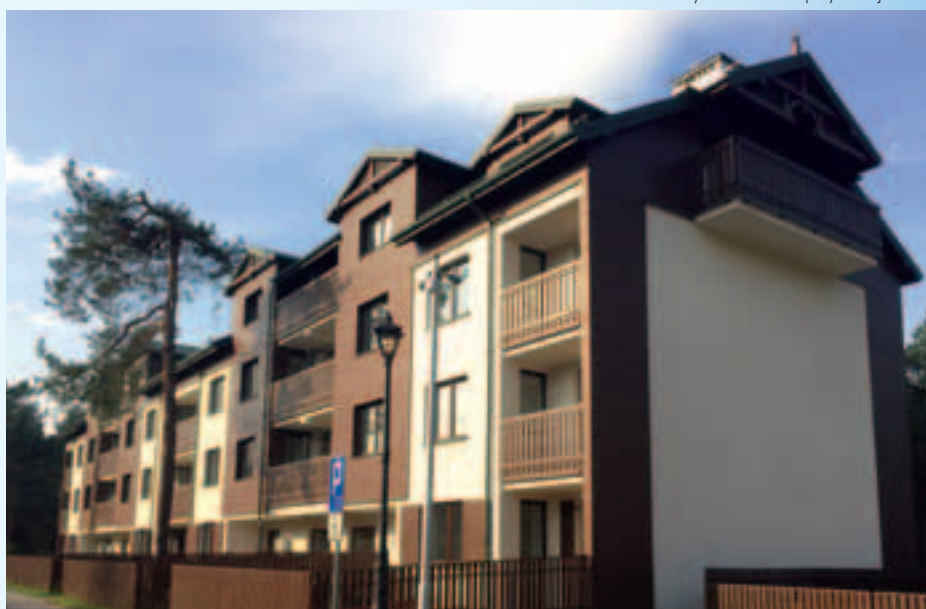
Budynek na osiedlu przy ul. Rejtana 5

Towarzystwo Budownictwa Społecznego w Józefowie Sp. z o.o. ul. Zielona 2, 05-420 Józefów, tel./fax 22-789-12-86, 22-789-21-44 www.tbsjozefow.pl, e-mail: tbs@tbsjozefow.pl