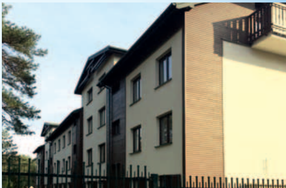
Budynek na osiedlu przy ul. Rejtana 1B