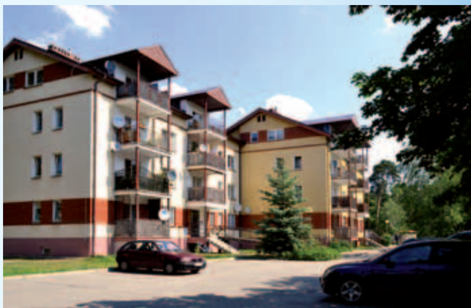
Budynki na osiedlu przy ul. 3 Maja 98 i 98A

przede wszystkim dla rodzin wykwaterowanych z rozebranego drewnianego budynku. Realizacja I etapu obejmowała również budowę pierwszego segmentu budynku przy ul. 3 Maja 98A, parking, altany śmietniko-