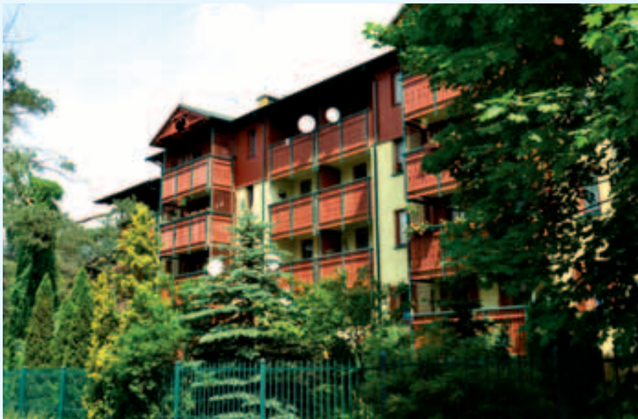
Budynki na osiedlu przy ul. Zielonej 2A, 2B, 2C