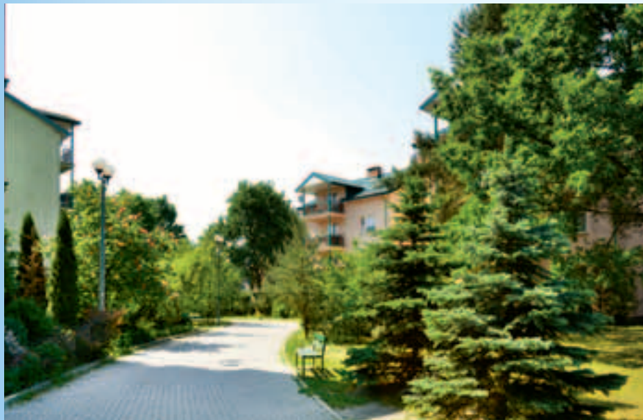
Budynki na osiedlu przy ul. Wroniej 9, 11, 13