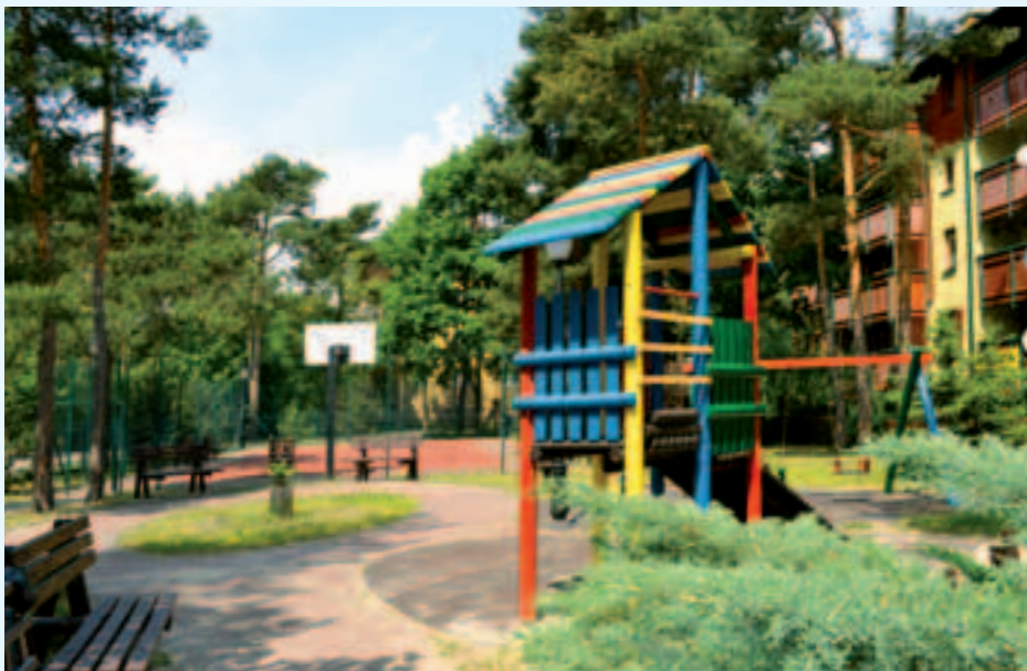
Plac zabaw na osiedlu przy ul. Zielonej 2A, 2B, 2C

we ogródki. W miejscu wyciętych drzew dokonano nowych nasadzeń drzew i krzewów. Najemcy lokali mieszkalnych posiadających przydomowe ogródki we własnym zakresie pięknie je zagospodarowali.