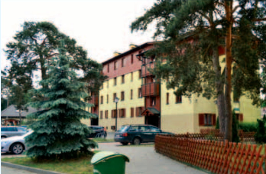
Budynki na osiedlu przy ul. Zielonej 2A, 2B, 2C