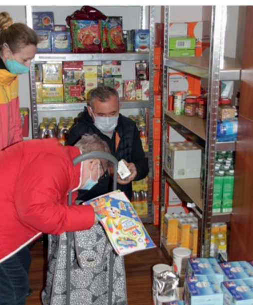
Punkt wydawania artykułów spożywczych i higienicznych