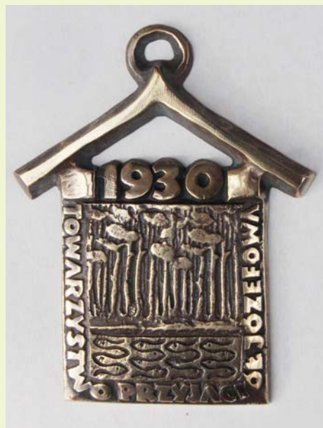
Plakietka nagrody TPJ