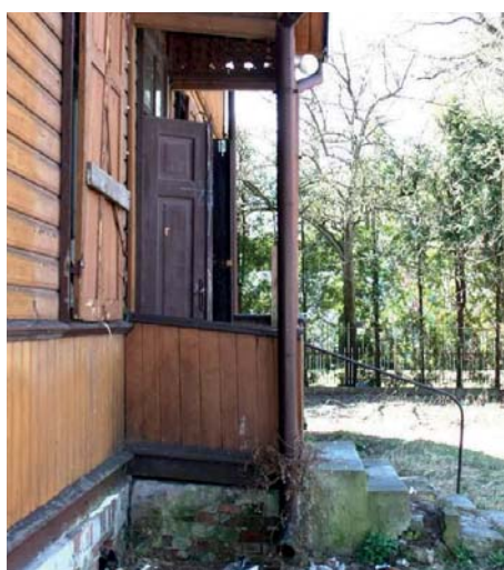
Konstrukcja ganku północnego – przed i po renowacji