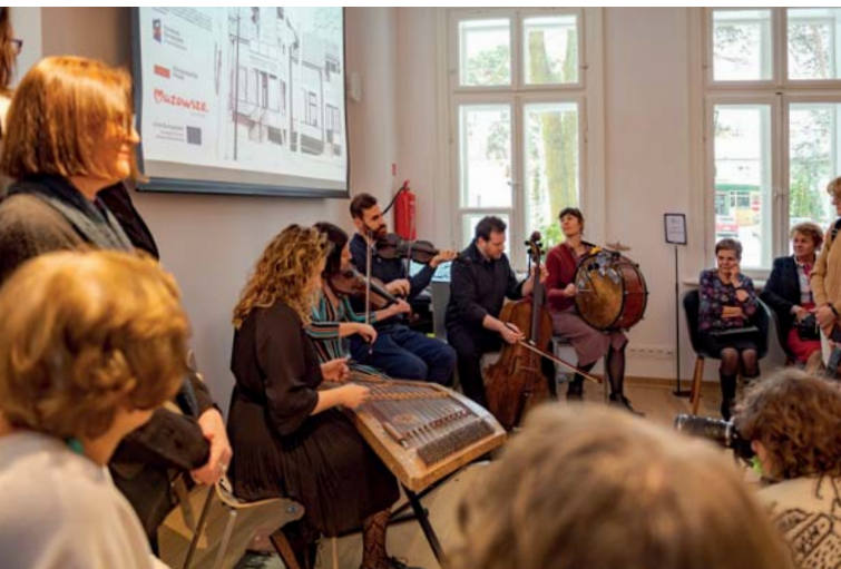
Klezmerski koncert Kapeli Niwińskich

Nie wybiła jeszcze 12.00, a pracownice MOK-u już wpuszczały do środka chętnych.