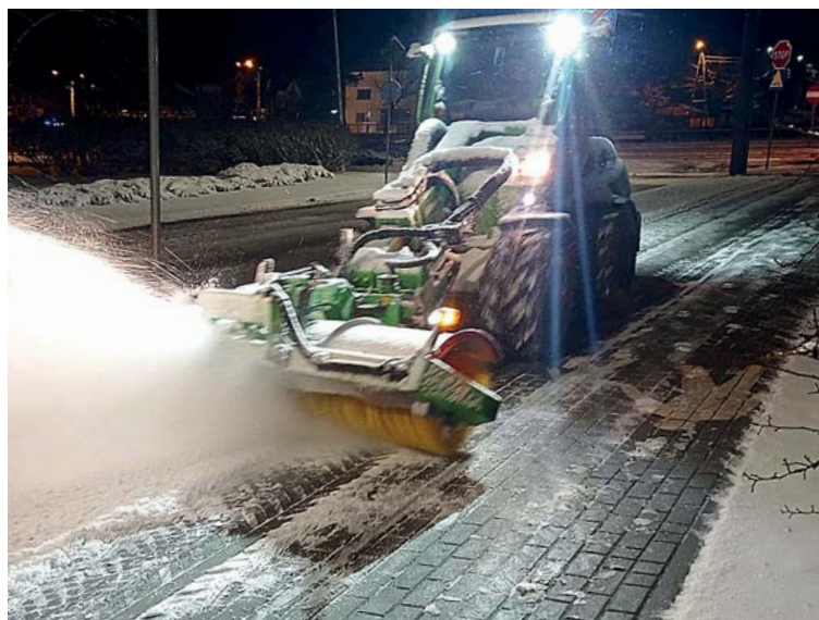
Pracownicy często zaczynają odśnieżanie o godz. 3.00 w nocy, by zapewnić mieszkańcom bezpieczeństwo poruszania się po mieście od rana.