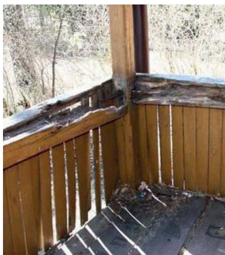
Balustrada werandy południowej – przed i po renowacji