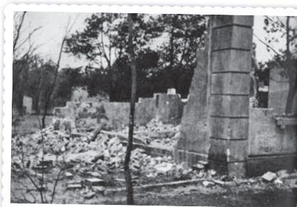
Wypalone gruzdy domu przy Słonecznej. Zdjęcie wykonał kilka dni po walce Bartłomiej Jahn ps. „Michał”

Prezentowane fotografie pochodzą z książek: „Obwodowe Oddziały Dywersji Bojowej Okręgu AK Warszawa. Dokumenty warszawskiego Kedywu z lat 1943–1945”, wyb. i opr. H. Rybicka, Warszawa 2010; J. K. Wroniszewski „Ochota 1939–1945”, Warszawa 1976