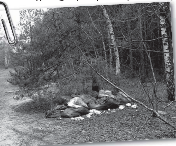
Śmieci przy ul. Głównej w Michalinie

przy jednoczesnym niskim poziomie kultury części użytkowników terenów naszego miasta.