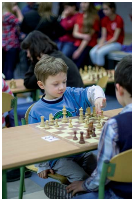
O imieninowym szachogranii czytaj na str. 5.