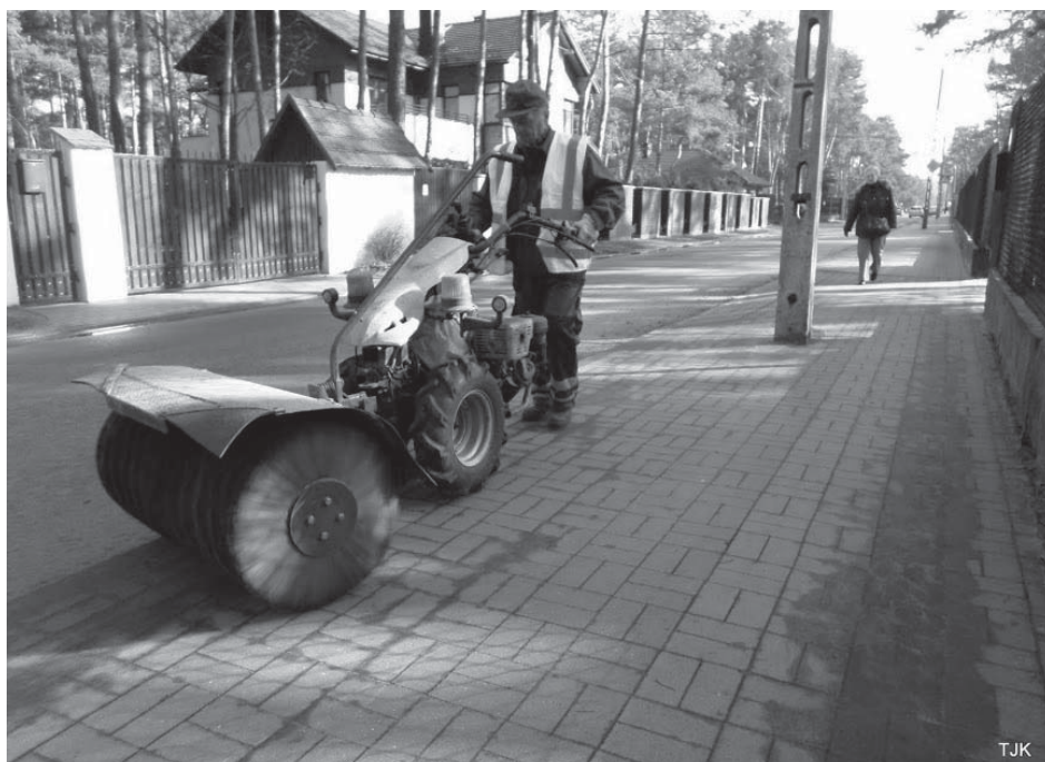
Zdjęcia z działań pracowników ZOM możecie Państwo obejrzeć na blogu Zakładu Oczyszczania w Józefowie: https://plus.google.com/110604554440545165401/posts