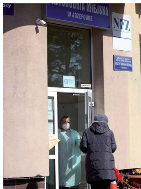
W miejskiej przychodni obsługa przez telefon, w przypadkach wskazanych przez lekarza wizyta.