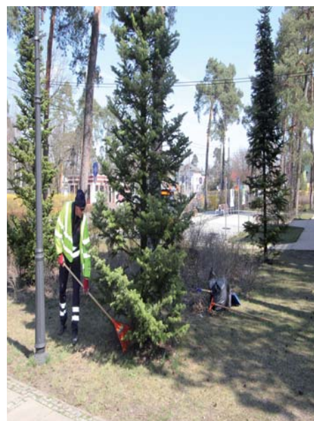
Zakład Piękne Miasto działa – wiosenne porządki