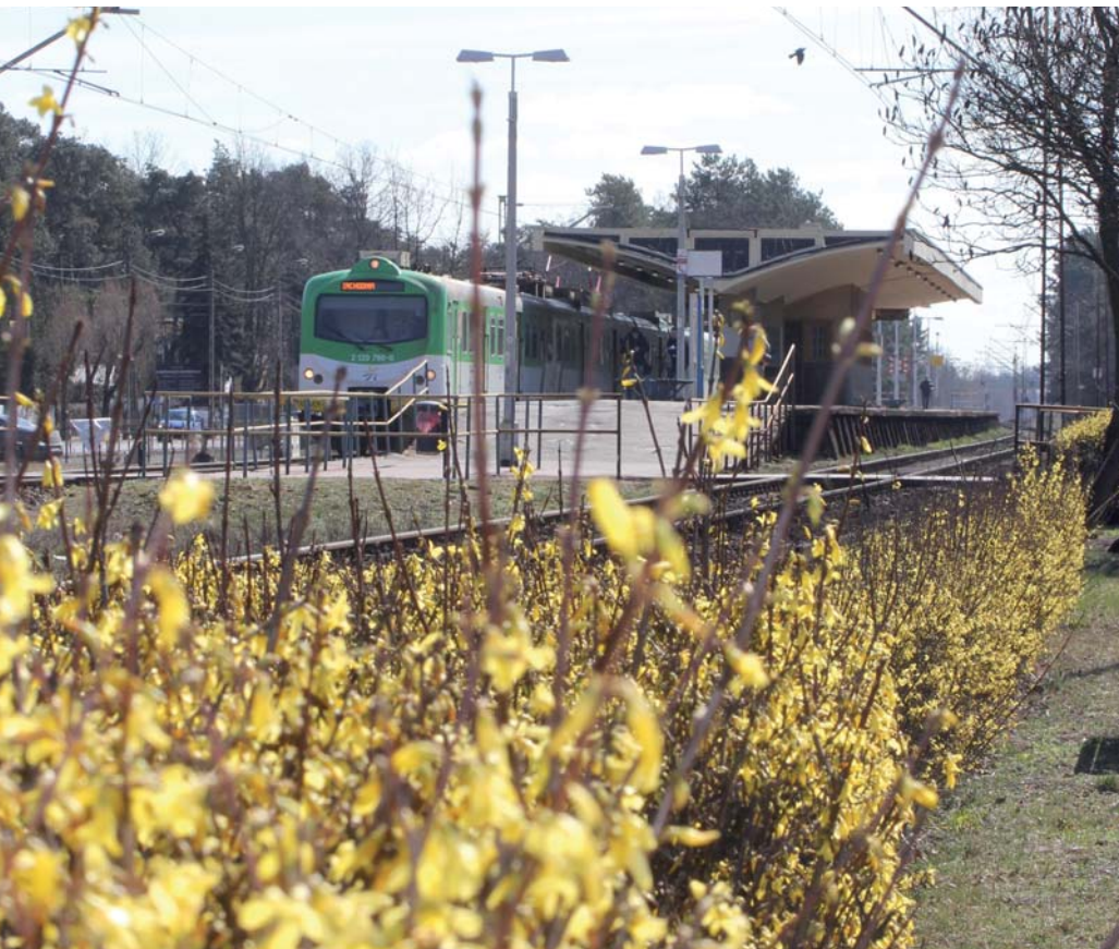
Komunikacja działa ale na zaostrzonych zasadach.