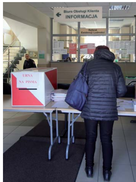
W Urzędzie Miasta składamy dokumenty