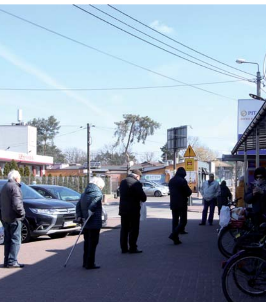
Przed sklepem – w bezpiecznej odległości od siebie