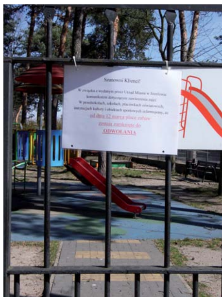
Place zabaw zamknięte