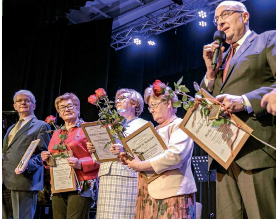
Laureaci wyróżnienia „Portula in Mundum”