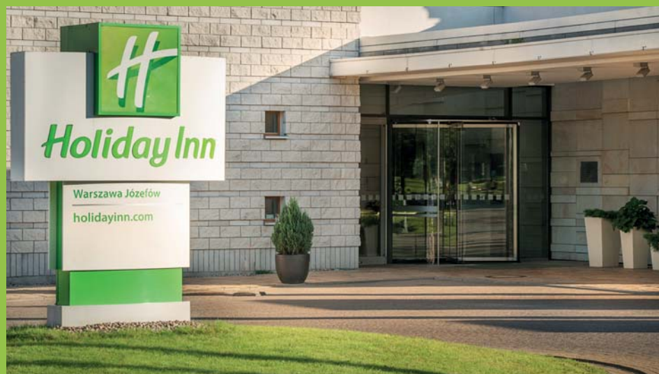
Zapraszamy również do wnętrza hotelu

■ Na stoisku Hildegard Braukmann Beauty Center w Józefowie poznacie z bliska produkty kosmetyczne firmy, a konsultantki odpowiedzą na Wasze pytania dotyczące oferty zabiegowej z zakresu pielęgnacji urody i medycyny estetycznej (beautycenters.com.pl).