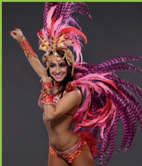
Tancerka Samby Art