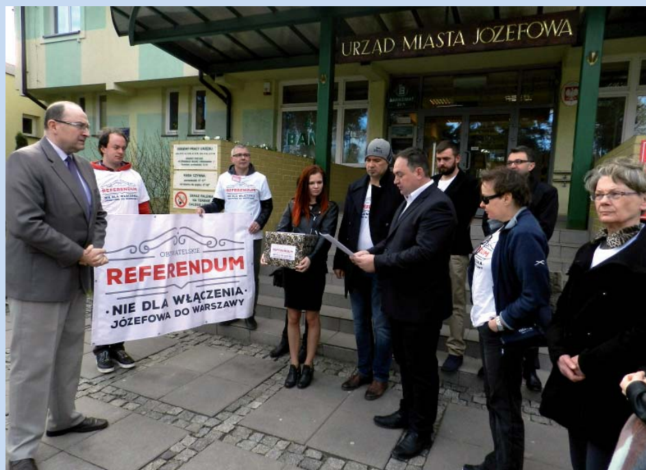
Obywatelski komitet przekazuje zastępcy burmistrza wniosek o przeprowadzenie referendum wraz z podpisami

Do tego wniosku przychyliła się józefowska Rada Miasta, która uchyliła uchwałę o organizacji referendum. Na razie. W przyjętym w uzupełnieniu tej decyzji Stanowisku Rady Miasta zapowiada: „Deklarujemy, że w przypadku pojawienia się nowego projektu metropolitalnego, który będzie budził uzasadniony niepokój i wątpliwości Mieszkańców, Rada Miasta Józefowa podejmie uchwałę o referendum.”