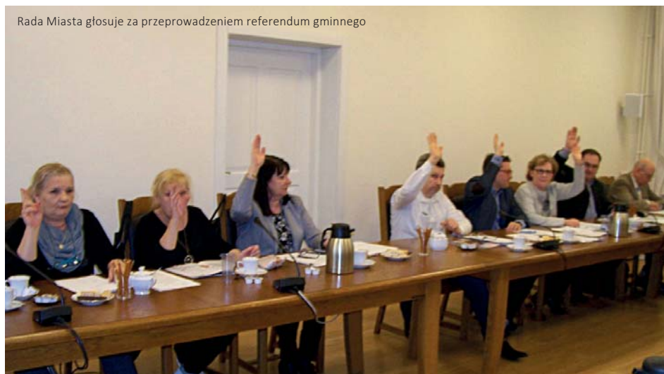
Rada Miasta głosuje za przeprowadzeniem referendum gminnego