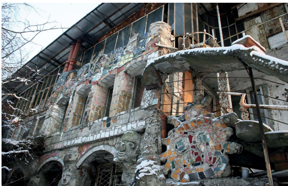
Niszczyjąca elewacja willi Tahiti