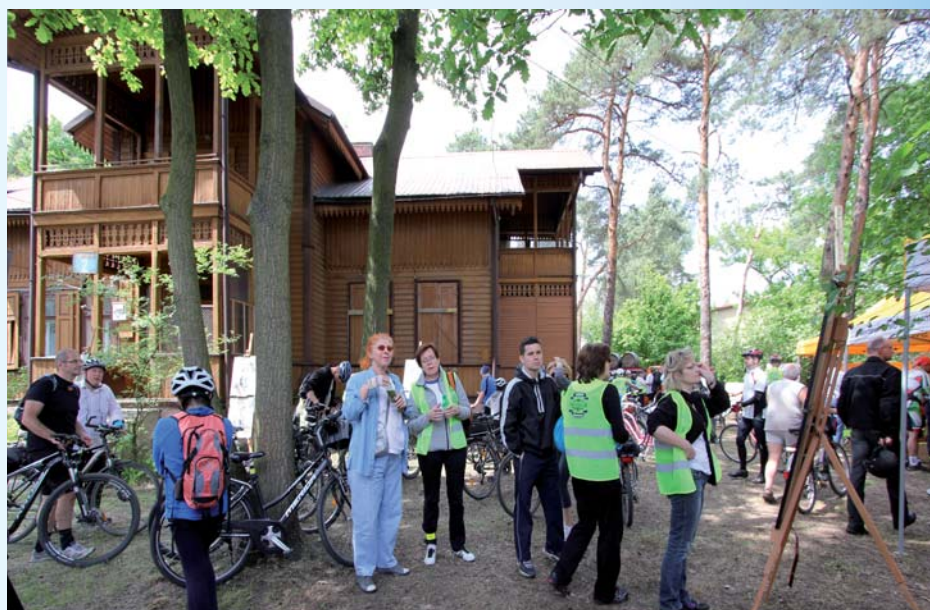
Do tej pory teren wokół świdermajera przy ul. Wyszyńskiego 2 otwierany był okazjonalnie, wkrótce, po przebudowie ma być nową siedzibą Domu Nauki i Sztuki – powyżej podczas festiwalu „Otwarte Ogrody” w 2015 roku

chitektury budynków, budowli i innych elementów zabytkowych; stosowanie nowej techniki w realizacji i w procesach technologicznych; jakość stosowanych materiałów (trwałość, estetyka); dostosowanie obiektów dla osób niepełnosprawnych.