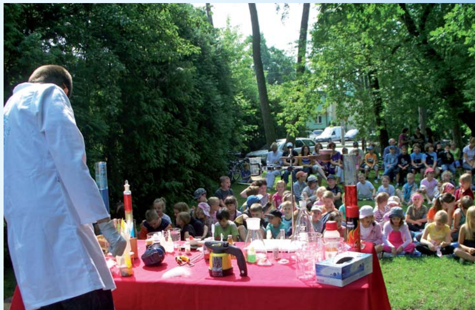
Zajęcia dla młodych odkrywców w dotychczasowym ogrodzie Domu Nauki i Sztuki

Oceniano: poziom rozwiązań architektonicznych i urbanistycznych; funkcjonalność modernizowanych i przebudowywanych obiektów i budowli; poziom zachowania ar-