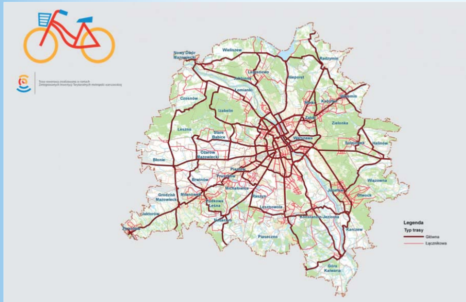
Planowany rozwój sieci dróg rowerowych metropolii warszawskiej do roku 2023

tylko 1/4 ogólnej długości dróg. Po zimie prawie każda gruntowa ulica wymagała równania oraz zasypywania dziur żużlem, ponieważ w sypkim, piaszczystym podłożu tworzyły się głębokie koleiny.