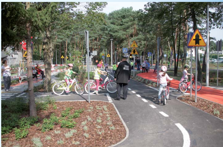
W miasteczku ruchu drogowego uczniowie poznają zasady bezpiecznego poruszania się po drogach