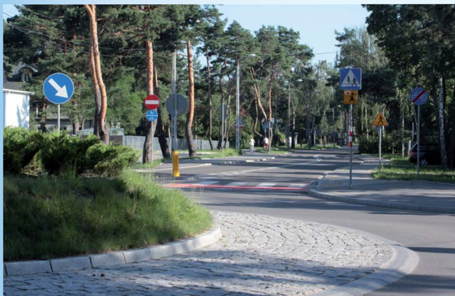
Przebudowane skrzyżowanie ulic Wawerskiej i Granicznej przy Szkole Podstawowej nr 2