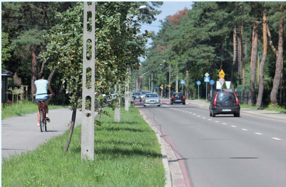
Nowa, wygodna ulica Wawerska została oddana do użytku jesienią 2015 roku

projekt organizacji ruchu i przejście dla pieszych na skrzyżowaniu ulic 3 Maja i Westerplatte.