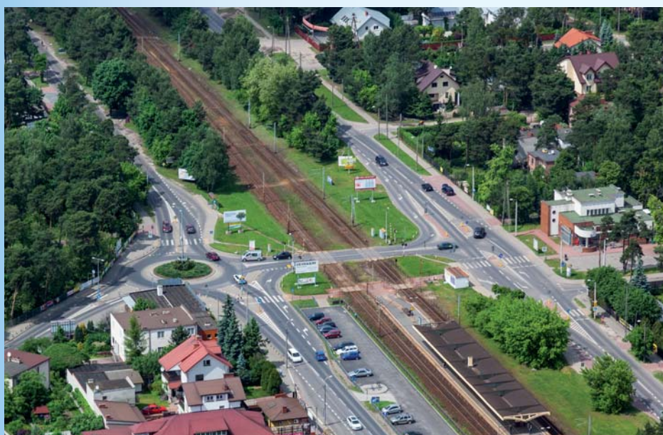
Rondo z jednej strony torów, a bezpieczne skrzyżowanie z drugiej przy przejeździe kolejowym w Michalinie