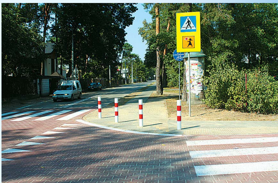
Wyniesione skrzyżowania mają wymusić na kierowcach zmniejszenie prędkości podczas przejazdu przez skrzyżowanie – róg ulic Leśnej i 3 Maja