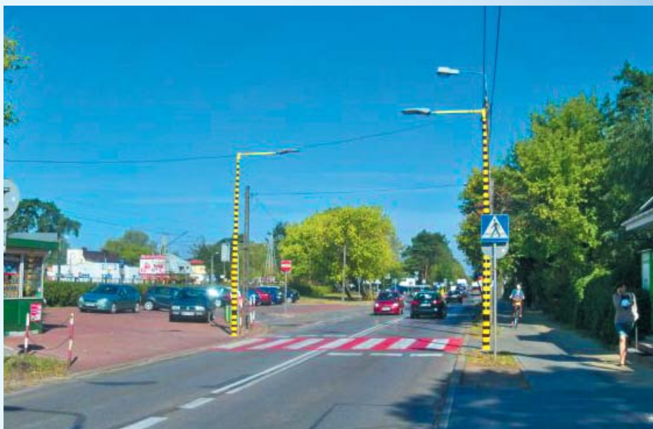
Miejsca szczególnie niebezpieczne zostały dodatkowo oznakowane i oświetlone – powyżej przejście dla pieszych przy zejściu z peronu przy ulicy Sikorskiego

O nim, podobnie jak o innych znamienitych postaciach więcej informacji możemy znaleźć w józefowskich zbiorach bibliotecznych.