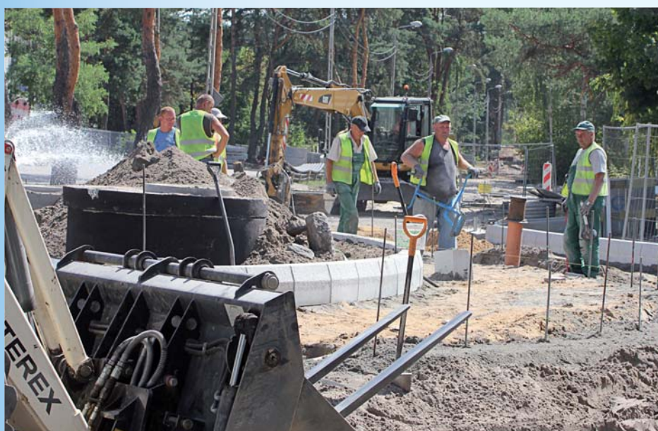
Tak wyglądały prace na obecnym rondzie im. Bronisława Kowalskiego latem 2015 roku