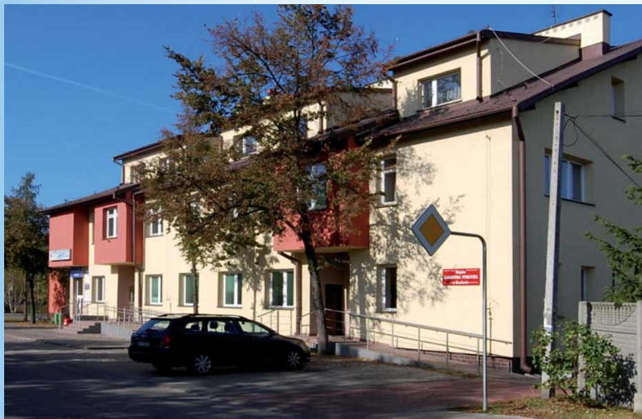
Główna siedziba biblioteki znajduje się w tym samym budynku co przychodnia miejska