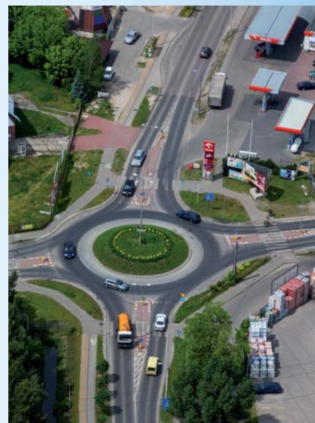
Tak wyglądało w latach 80. skrzyżowanie ulic Jarosławskiej i Piłsudskiego – w tym miejscu powstało pierwsze rondo w Józefowie