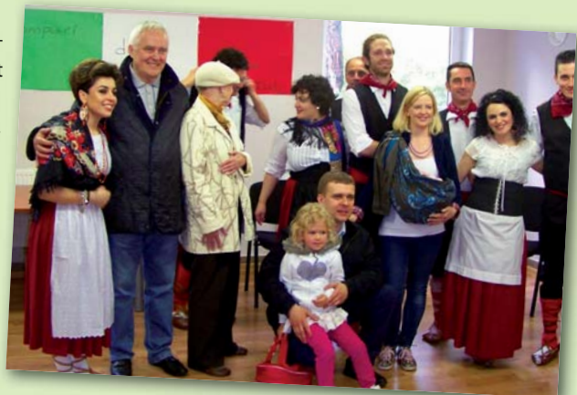
Włoski zespół w Ale Laba