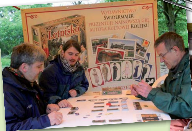
Zainteresowani grą planszową „Letnisko”

niskowa „Willa Reiswasera”. Zbudowań już nie ma, ale duch przeszłości jest dla wrażliwych wyczuwalny.