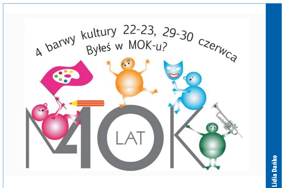
O jubileuszu MOK przeczytasz w sierpniowym „InS”