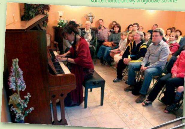
Koncert fortepianowy w ogrodzie Go-Arte

Artysta podchodził do każdego gościa z ogromną sympatią, tłumaczył różne techniki pracy, odpowiadał na wszelkie pytania i sypał anegdotami jak z rękawa – co fascynujące, rzadko je powtarzał, mimo licznych odwiedzin przez cały dzień. Chętni próbowali własnych sił w pracy z gliną, gipsem i drewnem. Bardzo liczymy na powtórkę w przyszłym roku.