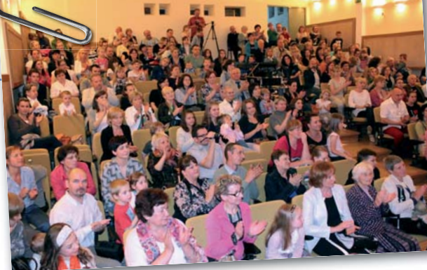
Odnowiona sala widowiskowa MOK

nawcy zdemontowali stary dach. Usunęli także wyeksploatowane wyposażenie sali widowiskowej. Specyfikacja zakładała także wykonanie instalacji elektrycznej i centralnego ogrzewania, oświetlenia sali, zabezpieczeń przeciwpożarowych oraz dachu nad salą widowiskową. Zamontowano nowe, wygodne fotele w liczbie 181. Prace remontowe trwały do października 2012 roku. Ich koszt wyniósł 611 tys. złotych.