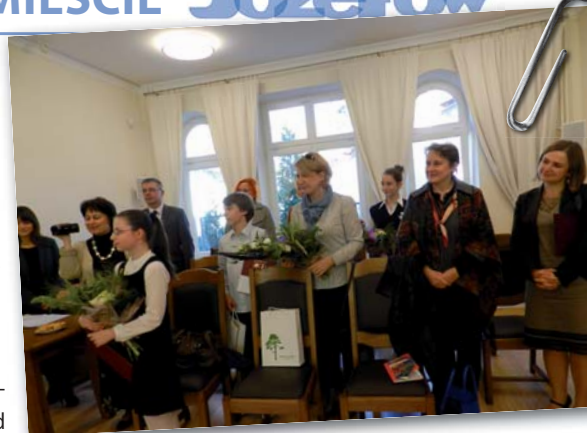
Stypendyści w odnowionej siedzibie RM

W 2011 roku Miasto Józefów rozpoczęło remont i przeznaczyło środki na remont budynku B Urzędu Miasta Józefowa. W ramach prac budowlanych został wykonany nowy dach, wymieniono okna, instalację elektryczną i teletechniczną, co, wodno-kanalizacyjną. Wymontowano łazienki, wymieniono podłogi, drzwi, balustradę. Dzięki wykonaniu naświetlenia klatka schodowa nabrała nowego blasku. Zamontowano nowe tablice informacyjne dla każdego referatu. Dla petentów załatwiających sprawy w Referacie