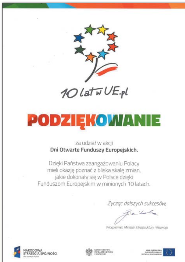
Podziękowanie od wicepremier E. Bieńkowskiej

Szczególnymi gośćmi tego wydarzenia byli młodzi mieszkańcy Józefowa. Czekala na nich moc atrakcji przygotowanych przez pracowników Hydrosfery i JRP: zwiedzanie stacji, filtrowanie i zabawy z wodą, poznawanie systemu SYMBIO (czyli jak małże pilnują jakości wody), konkursy, czy malowanie rury wodociągowej. Uczniowie otrzymali specjalne paszporty, a wykonane zadania potwierdzały pieczątki, a na koniec nagrody.