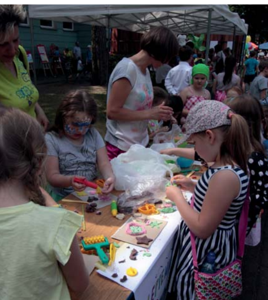
Piknik rodzinny w Szkole Podstawowej nr 1