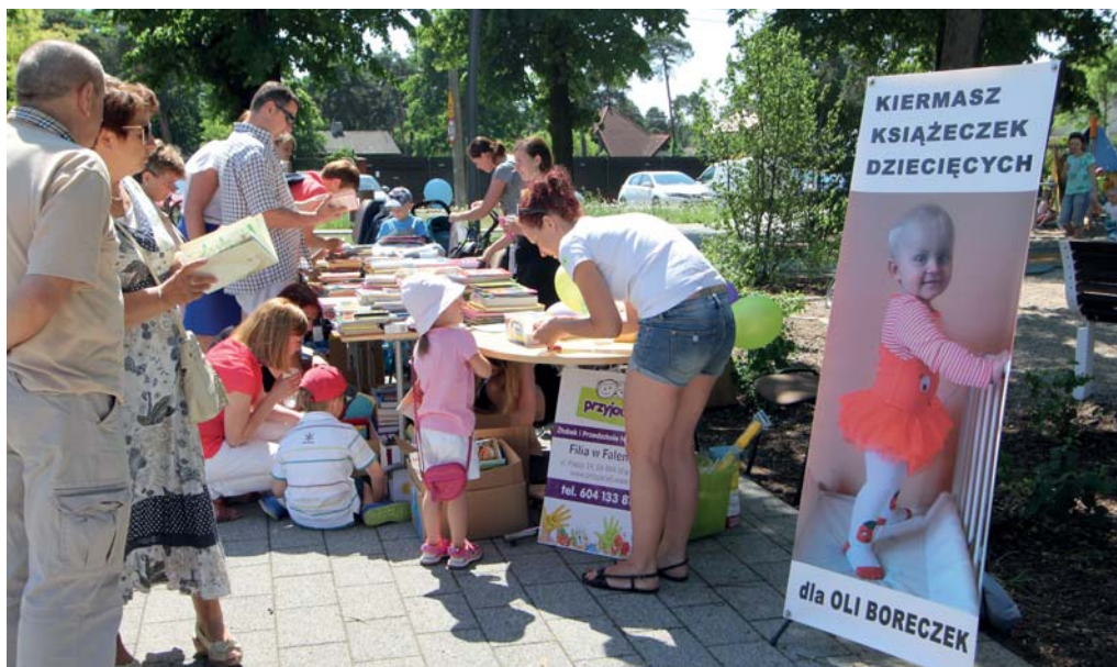
Kiermasz towarzyszący „sąsiedzkiemu śniadaniu” w parku przed MOK-iem