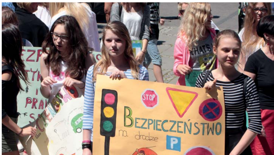
Uczniowie gimnazjum wzięli udział w marszu bezpieczeństwa

JUŻ OD PRZEDSZKOLA NALEŻY KONCENTROWAĆ SIĘ NA KSZTAŁTOWANIU U DZIECI POCZUCIA RYZYKA W RUCHU DROGOWYM ORAZ ROZWIJANIU UMIEJĘTNOŚCI RADZENIA SOBIE W NIEBEZPIECZNYCH SYTUACJACH. MUSIMY JEDNAK PAMIĘTAĆ, ŻE DOŚWIADCZENIA DZIECI SĄ ZBYT MAŁE, ABY MOGŁY ONE OCENIAĆ I PRZEWIDYWAĆ SKUTKI DZIAŁAŃ WŁASNYCH I INNYCH OSÓB W RUCHU DROGOWYM.