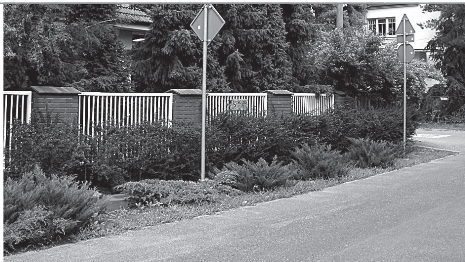
Gałęzie wychodzące w światło drogi przy ul. Granicznej (powyżej) Niezgodne z przepisami nasadzenia w pasie drogowym przy ul. Rozkosznej (na dole)