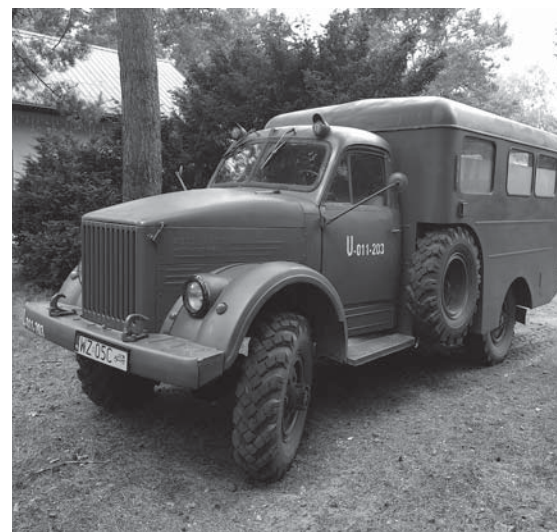
Dawny ambulans – GAZ-63. Obecnie wykorzystywany do transportu na Górę Lotników podczas wycieczek szkolnych.

Ze względu na stały rozwój i modernizację placówki zaleca się wcześniejsze zgłoszenie wizyty telefonicznie.