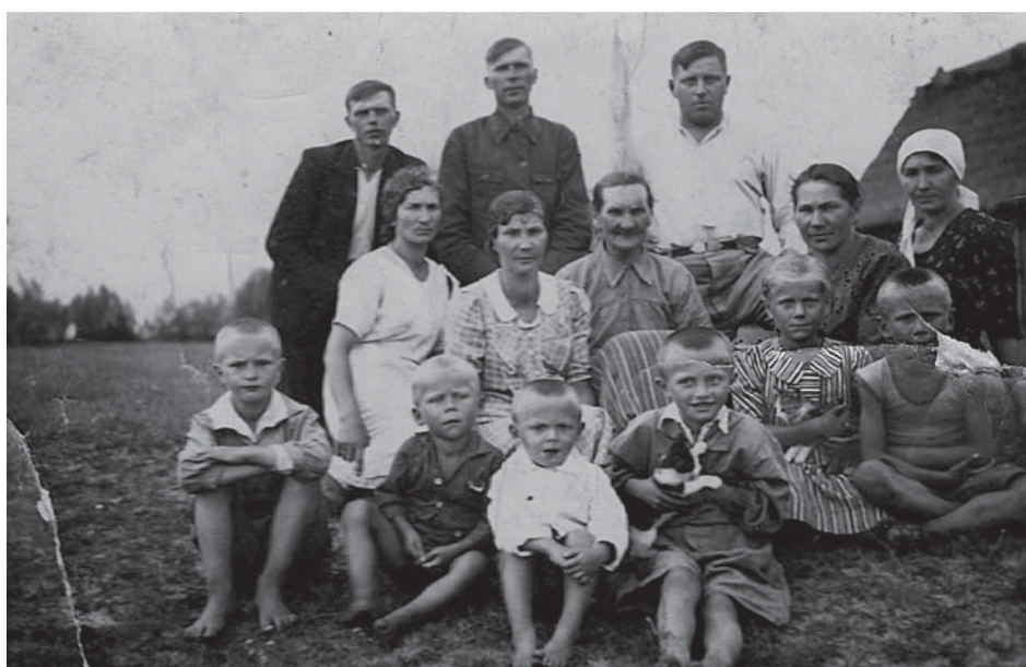
1942 – Rodzina Pucha

CATL – to szansa na ocalenie naszych wspomnień od zapomnienia. Dzięki programowi Fundacji Ośrodka KARTA mamy szansę na zachowanie pamiątek dla przyszłych pokoleń. Proszę zadzwonić do nas lub przyjść osobiście do biblioteki. Wykonamy cyfrową kopię takiego dokumentu lub fotografii, u Państwa nadal będzie oryginał, a w archiwum społecznym w naszej bibliotece – kopia. Zapraszamy do współpracy firmy i instytucje z terenu Józefowa, każda na pewno ma swoją historię do opowiedzenia. To Państwo tworzący społeczne archiwum historyczne naszego miasta. Udostępniając je bibliotece do zeskanowania możesz ocalić je przed zapomnieniem i bezpowrotnym zniszczeniem. Zapraszamy!