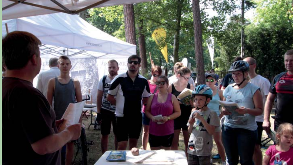
Gra miejska Wydawnictwa Świdermajer

IX edycja organizowanego przez Miejski Ośrodek Kultury i mieszkańców Józefowa Festiwalu Otwarte Ogrody, połączona z wydarzeniem „Sąsiedzkie śniadanie. Sąsiedzkie Letnisko”, odbyła się w dniach 9–11 czerwca pod honorowym patronatem Polskiego Komitetu do spraw UNESCO, Narodowego Instytutu Dziedzictwa oraz Burmistrza Miasta Józefowa.