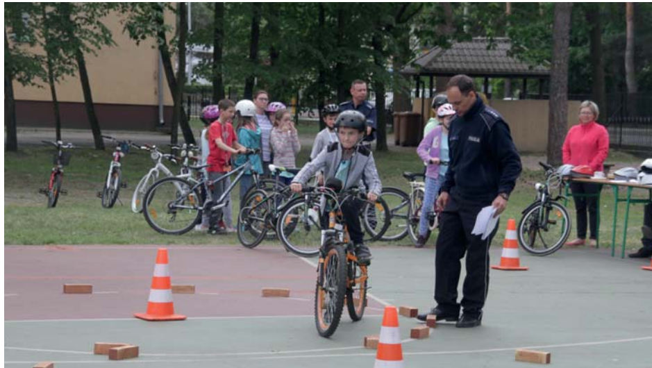
Uczniowie szkoły podstawowej w mobilnym miasteczku ruchu drogowego

Cele procesu edukacyjnego to kształcenie nawyków poprawnego zachowania w ruchu drogowym jako pieszy, pasażer, rowerzysta. Ich realizacja przyczyni się do wszechstronnego rozwoju uczniów, kształtowania zachowań prozdrowotnych i pro-