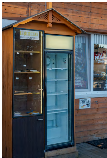
Przy ul. Polnej 1, obok piekarni stoi książkodzielnia, a obok lodówka, można tam podzielić się z innymi nadmiarem jedzenia