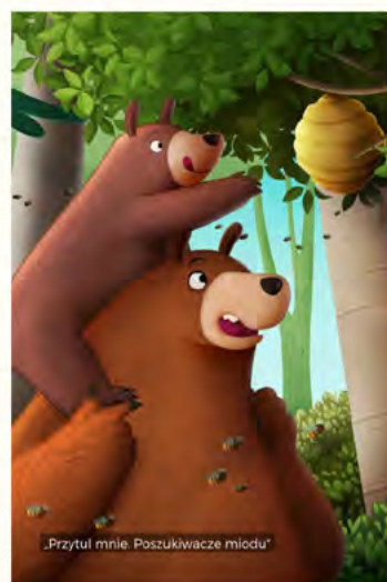
„Przytul mnie. Poszukiwacze miodu”