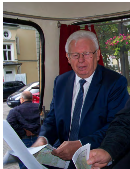
Komisja rusza „ogórkem” spod budynku Rady Miasta