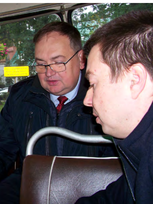
na wizję lokalną Nadwiślanki.

Dyrektor Dąbrowski zaznaczył również, że każde rozwiązanie spowalniające ruch bę-