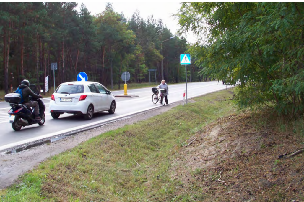
Przejście dla pieszych przez Nadwiślańską przy Górczewskiej prowadzi wprost do rowu.