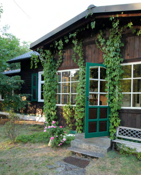
Dom z lat 30. XX w. w Michalinie – jeden z punktów programu listopadowej wycieczki

Spacery to lekarstwo – powiedział lekarz ortopeda, który po raz kolejny ratował mój kręgosłup zmęczony ślęceniem przed komputerem. – Kiedy wędrujesz dość szybko, pozostawiasz za sobą wszystkie smutki i niepokoje. To podstawa zdrowia.