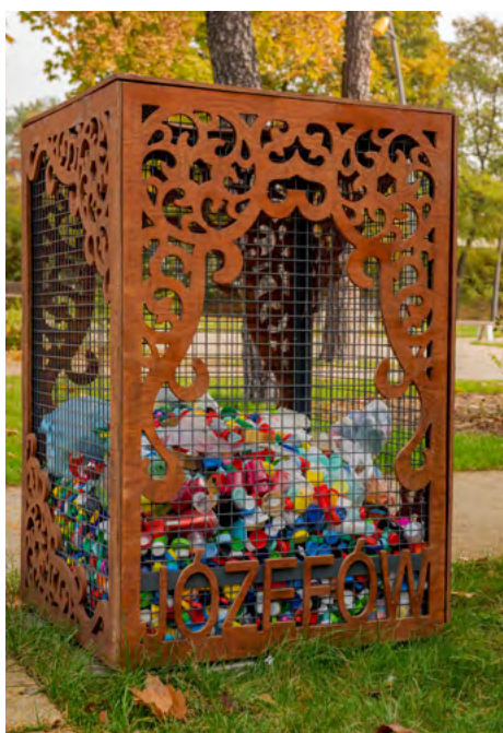
Plastikowe nakrętki można wrzucać do specjalnych pojemników m.in. przy MOK-u oraz przy SP1