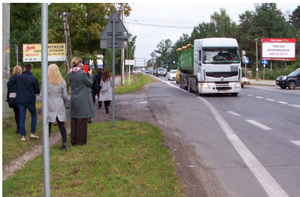
Brak chodnika, a nawet pobocza wzdłuż trasy 801 od skrzyżowania z Wyszyńskiego do Otwocka.