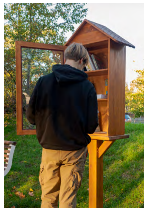
Ta książkodzielnia znajduje się na skwerze im. św. Jana Pawła II, podobna pojawi się przy budowanym nad Świdrem pumtracku