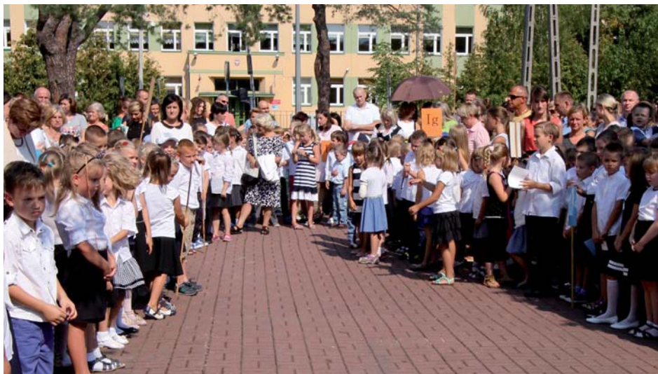
Inauguracja roku szkolnego

Myślę, że w nowoczesnym nauczaniu powinno się kłaść duży nacisk na nabywanie przez uczniów kompetencji społecznych, które sprawiają, że dzieci lepiej radzą sobie z porażkami, mają więcej motywacji do nauki, potrafią rozwiązywać konflikty w grupie czy okazywać swoje uczucia tak, aby nie krzywdzić innych. Powinniśmy też pozwolić uczniom