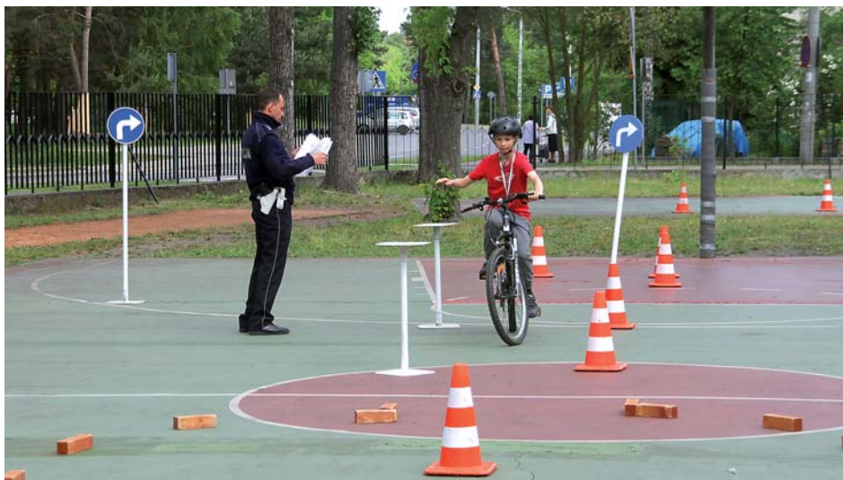
Egzamin na kartę rowerową w SP2

pomocy dziecku i rodzinie – wspomaga i uzupełnia pracę szkoły.