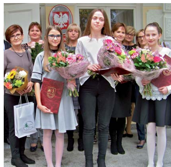
Ubiegłoroczn laureaci stypendium im. św. Jana Pawła II

Wybitnie uzdolnionym uczniom miasto przyznaje dwa rodzaje stypendiów za szczególne osiągnięcia w nauce: stypendium Mł-