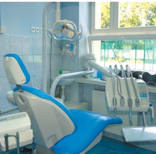
W dwóch józefowskich szkołach są nowoczesne gabinety stomatologiczne

► dzień poznaje Europę, które przyznawane jest szkołom na pokrycie kosztów transportu związanego z wymianami zagranicznymi uczniów oraz indywidualne stypendium im. Jana Pawła II.