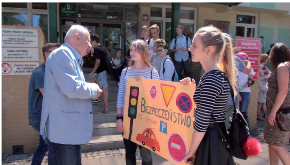
Młodzież z SP3 rozmawia z burmistrzem o bezpieczeństwie na drogach