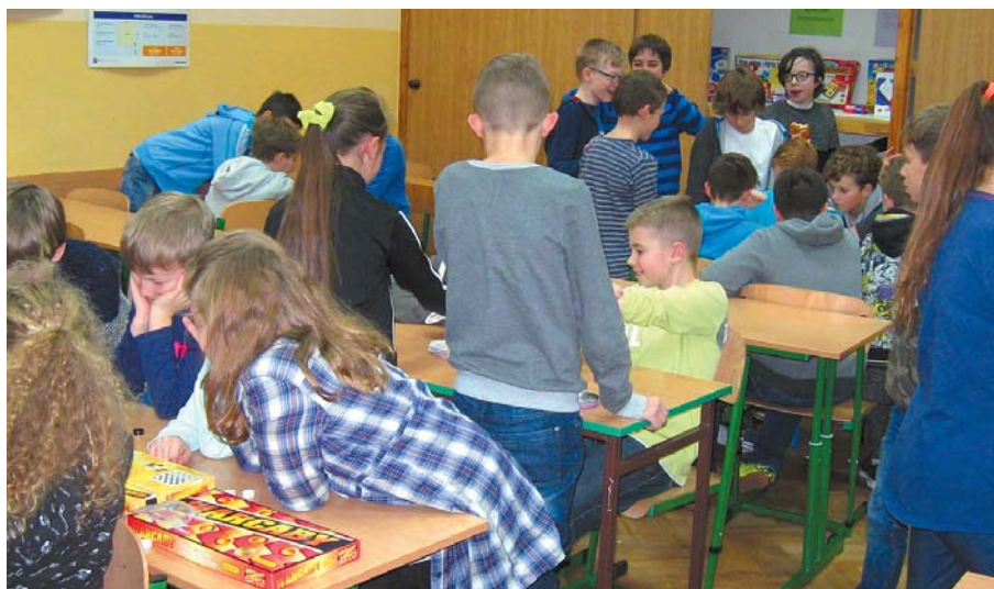
Aktywne przerwy w józefowskiej szkole

W dokumentach wewnątrzszkolnych określiliśmy sylwetkę absolwenta Szkoły