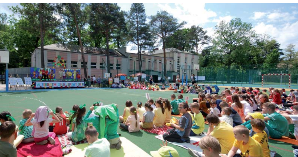
Piknik promujący zdrowy styl życia na nowym boisku w SP1

To m.in. dzięki tym pieniądzą w naszych szkołach działają świetlice, w których uczniowie przebywają przed lub po zajęciach szkolnych. Świetlica jest bardzo ważną formą