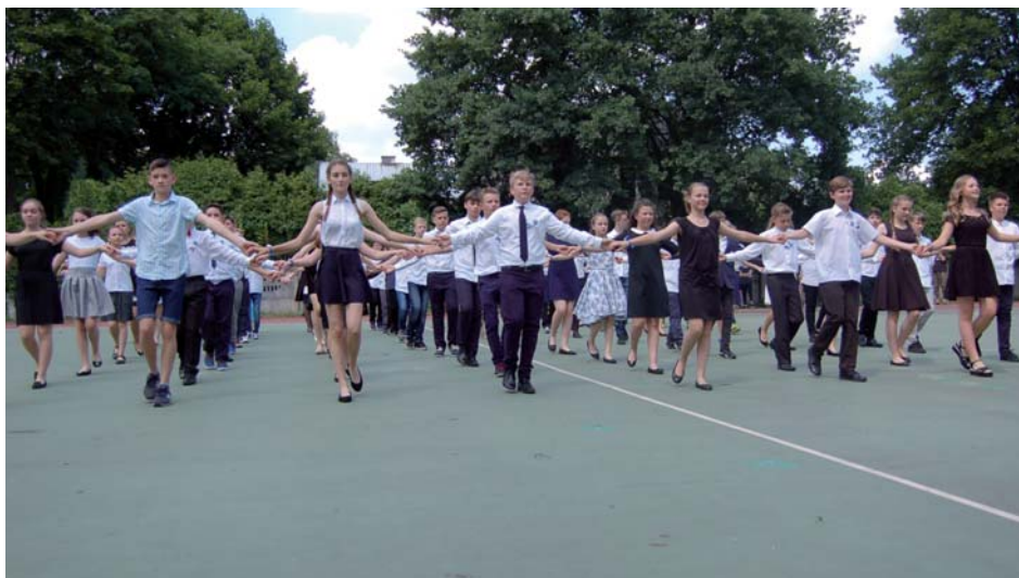
Polonez na zakończenie gimnazjum

na poszukiwanie, wnioskowanie, a nawet popełnianie błędów, bo przecież poprzez błędy także się uczymy. Myślę, że także sposób oceniania ucznia jest bardzo istotny. Ocena stopniem w skali od 1 do 6 pokazuje, na ile uczeń opanował treści podstawy programowej, ale nie wskazuje mu, co powinien jeszcze zrobić, nad czym i w jaki sposób pracować, aby uzyskać lepsze wyniki, a przede wszystkim opanować wiadomości i treści podstawy programowej. Wdrażany w ostatnim czasie w szkołach model oceniania kształtującego może pomóc zarówno uczniom, jak i nauczycielom w dążeniu do tworzenia lepszej szkoły: patrzącej w przyszłość, nastawionej na ucznia – szkoły wspierającej zarówno rozwój ucznia, jak i nauczyciela.