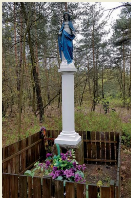
Figura na ul. Dziekońskiej