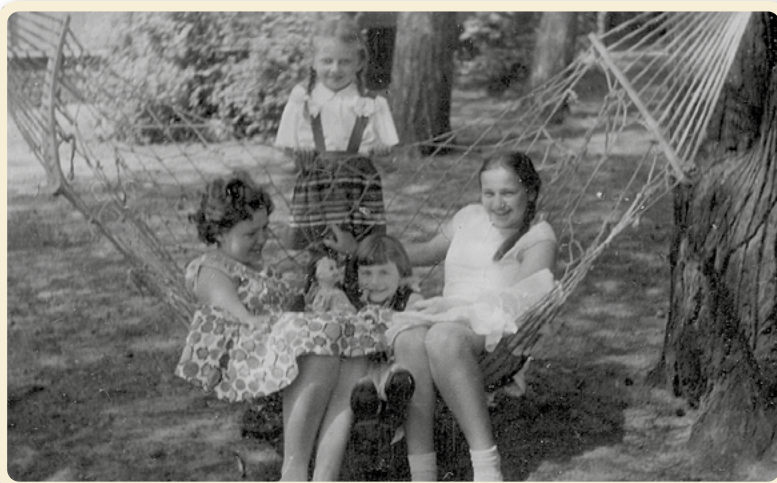
1960. Siostry Bieńkowskie