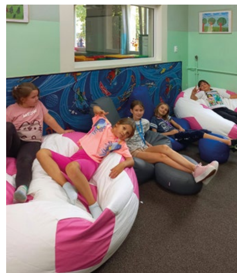
Nowy kącik wypoczynku