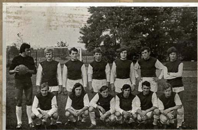
Drużyna Józefovii (1975 r.) - awans do A-Klasy

Józefovia Józefów - 65 lat tradycji i gry z pasją!