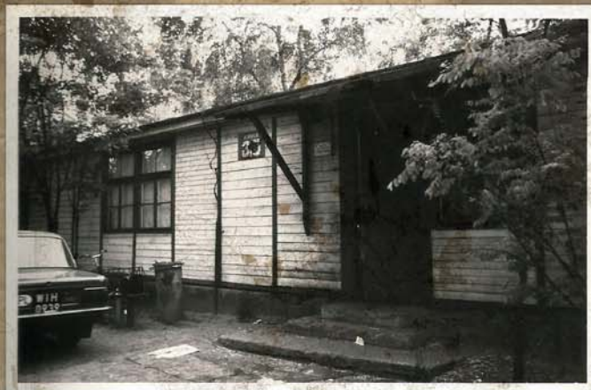
Pierwsza siedziba klubu ul. Telimeny 3/5 w Józefowie