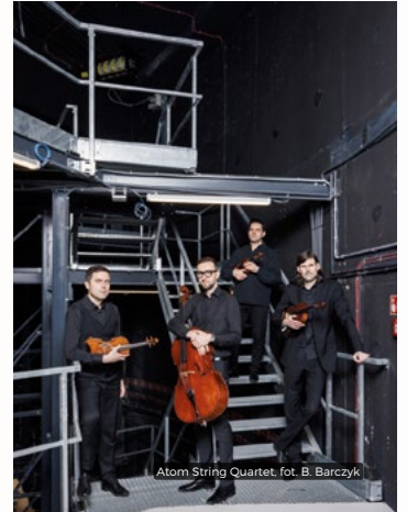
Atom String Quartet

18.00 Scenariusze przyszłości: „Przemiany społeczne i konflikty międzypokoleniowe” /wykład, wstęp wolny, DNIS/Willa Frankówka