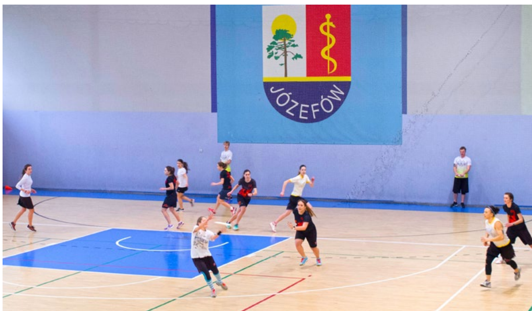
Frisbee w październiku ponownie zagości w Józefowie