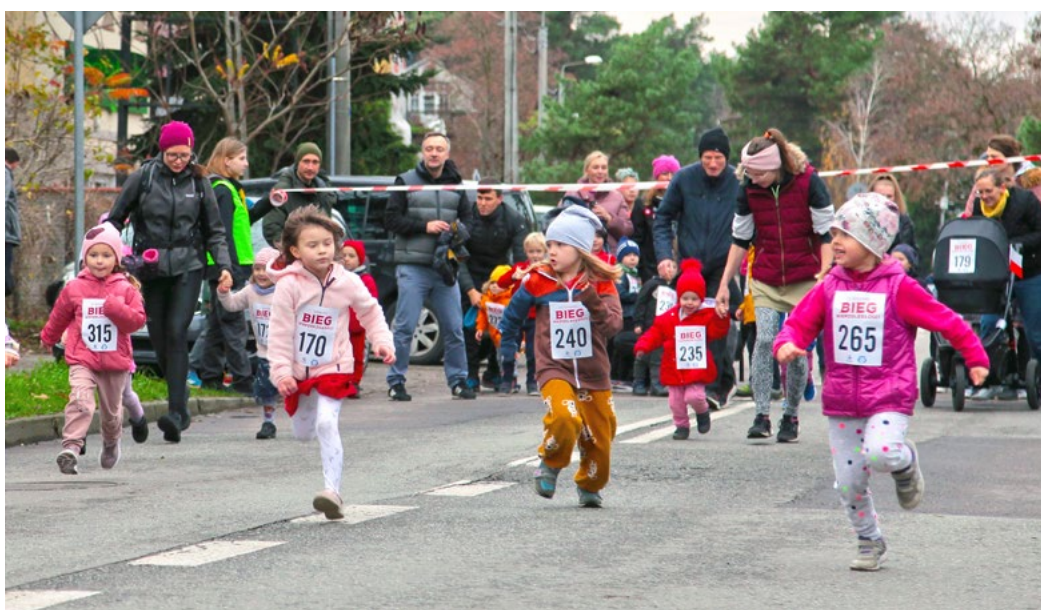
Najmłodszy uczestnicy biegu co roku, niezależnie od pogody, prezentują ogromne zaangażowanie

skania niepodległości na sportowo! Uczestnicy pobiegą ulicami miasta, dla każdego przewidziany jest pamiątkowy medal, a dla zwycięzców poszczególnych kategorii